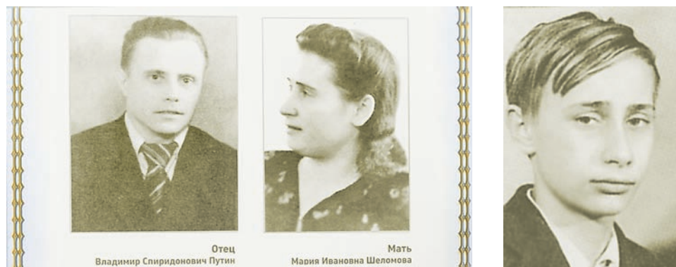
В доме Куварина на почетном месте книги о Путине и та самая энциклопедия, где его имя соседствует с именем президента

Новые факты о тверских корнях действующего президента страны