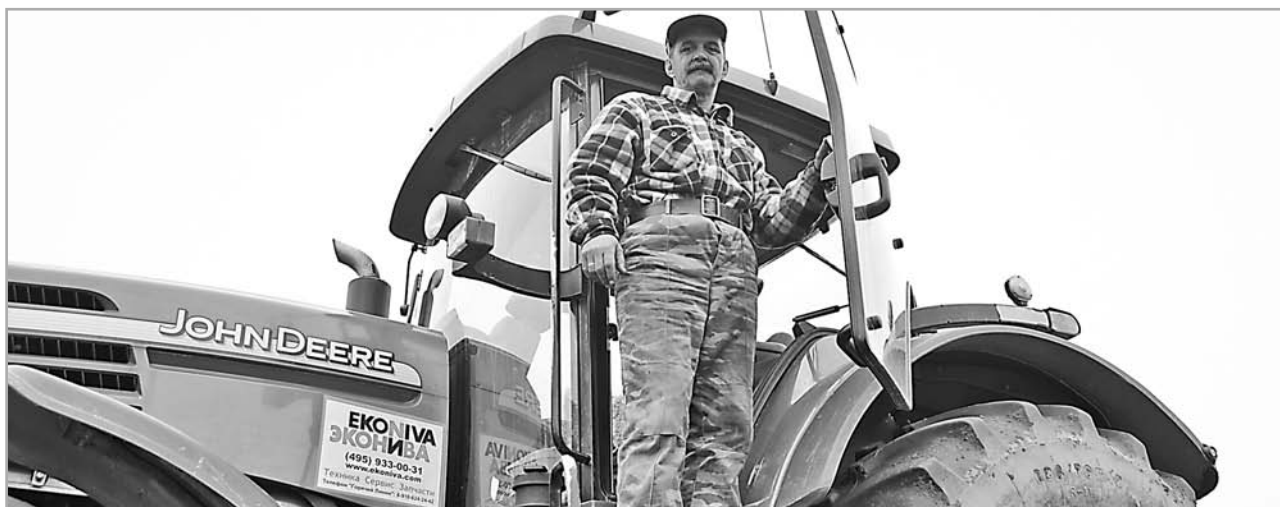
Сельхозпроизводители Тверской области смогут приобрести в лизинг технику и оборудование с отсрочкой первого платежа в шесть месяцев и без залога

Подписанные главой региона соглашения будут способствовать позитивным переменам на селе, поэтому я углубленнее сотрудничаю с ведущими кредитными организациями