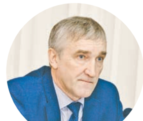
Александр КУШНАРЕВ, председатель комитета Законодательного собрания Тверской области по аграрной политике:

– В Тверской области до сих пор остается много неиспользуемых земель сельхозназначения. Необходимо возвращать их в экономику, в активный оборот. Нередко заброшенные земли требуют уточнения их правового статуса, это неиспользуемые земельные паи, земли, или земли, которые не используют по назначению. Муниципалитетам надо активнее работать над возвращением в оборот заброшенных земель – и прокуратура всегда готова оказывать содействие главам муниципальных образований. Возможно, Тверская область нуждается в проведении земельной ревизии, чтобы было понятно, какими потенциальными земельными ресурсами располагает регион.