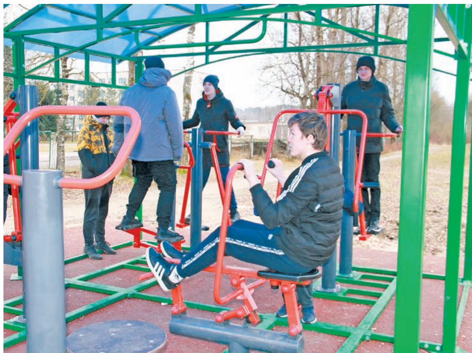
У студентов Нелидовского колледжа появилась замечательная возможность тренироваться, сдавать зачеты, готовиться к спортивным мероприятиям на новой спортивной площадке

Турники, скамьи для пресса, тренажеры для ног и укрепления мышц – 10 современных снарядов уже оценили и взрослые, и дети. В первые же дни после установки комплекса сюда потянулись приверженцы здорового образа жизни самого разного возраста.