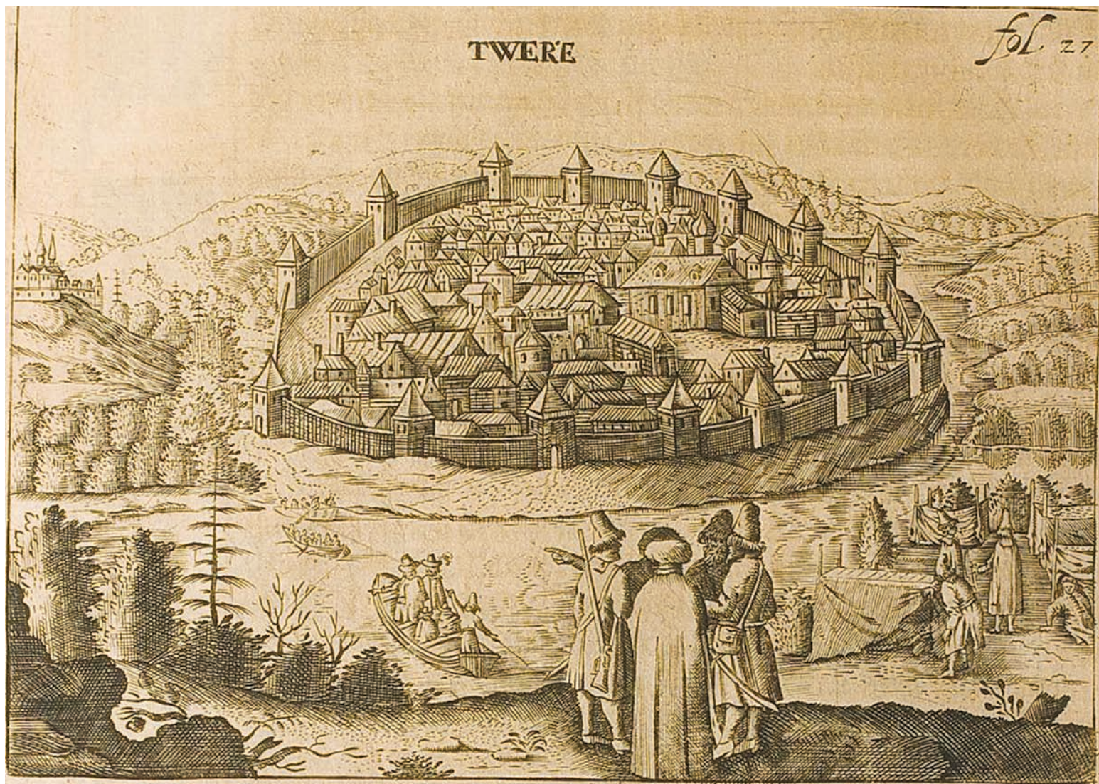
Тверь. Рисунок из альбома А. Олери. 1630-е гг.