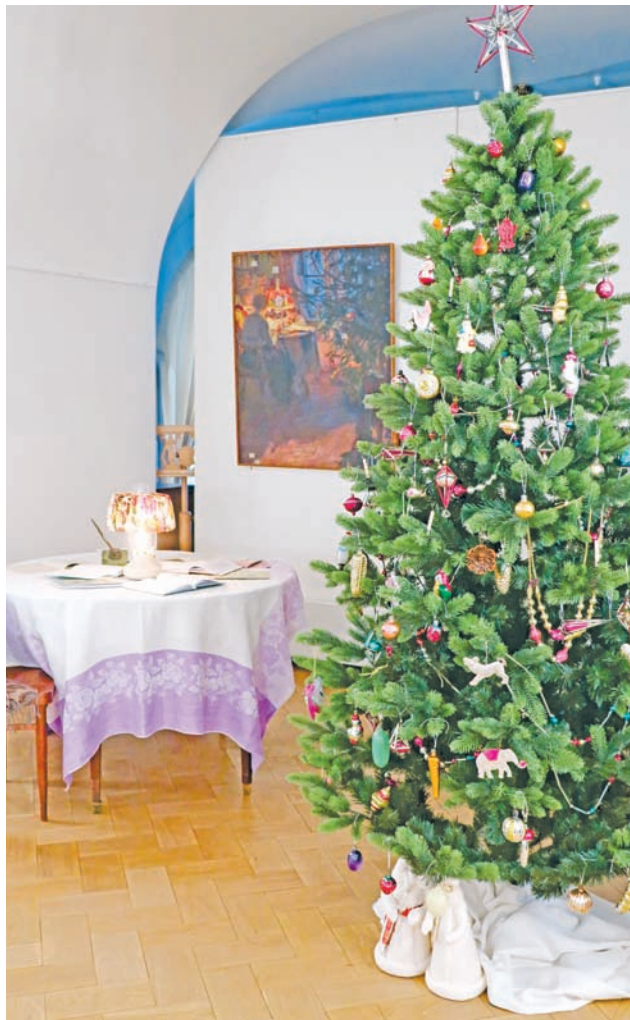
В Тверском Императорском дворце создана инсталляция к картине Александра Моравова «Елка в семье художника»

В праздничные дни приобщаемся к изобразительному искусству