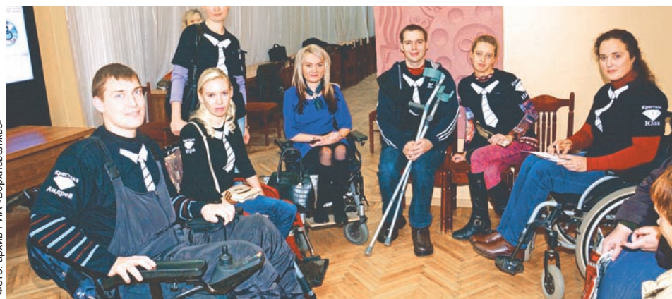
Среди тверских инвалидов немало тех, кто активно способствует интеграции в общество людей с ограниченными возможностями

Участники вебинара активно делились опытом