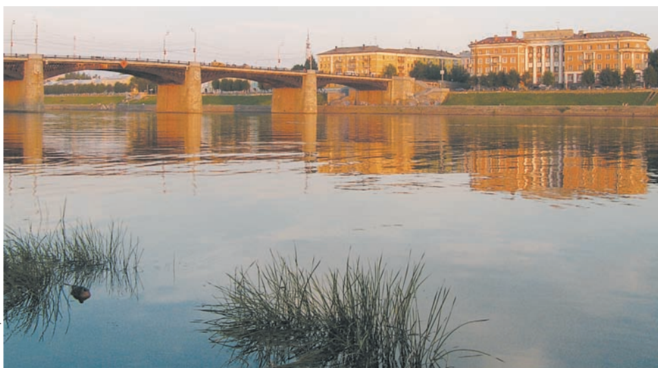
Новый мост через Волгу

Но что самое интересное, есть в Твери мост, который гораздо старше, и именно его по праву можно считать первым мостом через Волгу в черте города. Догадались, о чем идет речь? Разумеется, все довольно просто – это Железнодорожный мост, который был открыт еще в 1850 году. Однако в силу транспортной специфики его обычно не учитывают в разговорах о «первенстве». А Старый мост – это, если быть предель-