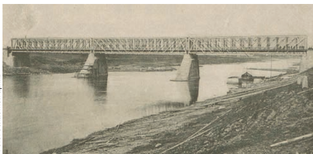
Железнодорожный мост через Волгу – самый старый действующий мост в Твери

но точными, первый постоянный мост для пешеходов и сухопутного, не железнодорожного транспорта. До этого две части нашего города соединяла лишь понтонная, а вернее, плашкоутная (наведенная с помощью плоскодонных судов-плашкоутов) переправа в районе нынешнего городского сада.