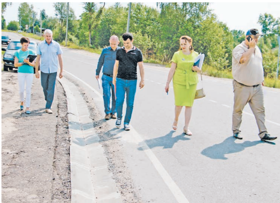
Дороги в Нелидово после ремонта принимают с особой тщательностью

Нелидовский городской округ – активный участник программы