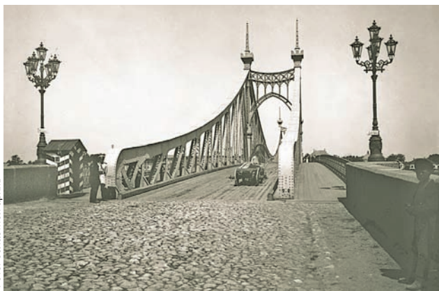
Старый мост через Волгу