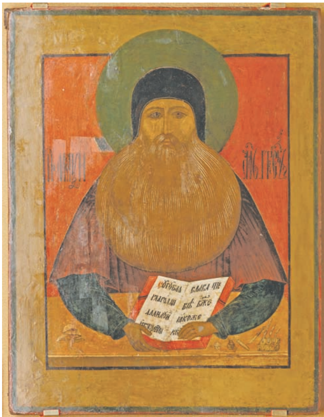
Максим Грек. Поясное изображение святого в монашеском одеянии, с широкой окладистой бородой, держащего перед собой на столе раскрытую книгу с текстом: «Сугубая глаголаи аллилуйи...» На столе стоит чернильница, лежат перья и предметы для письма. Государственный музей истории религии

Как тверской епископ на Пасху с врагом примирился