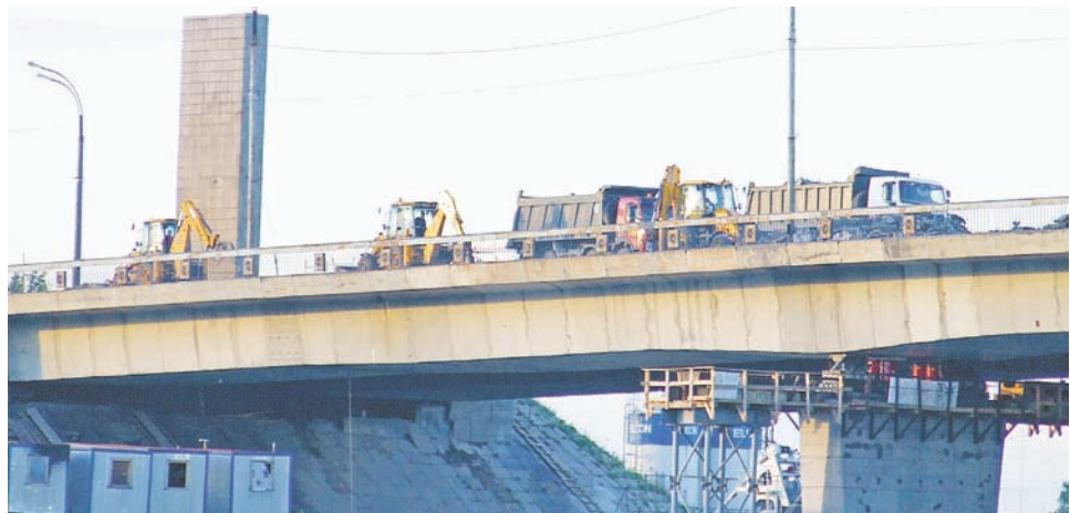
Ремонт Восточного моста в 2013 году

А пока новая переправа будет расти на наших глазах.