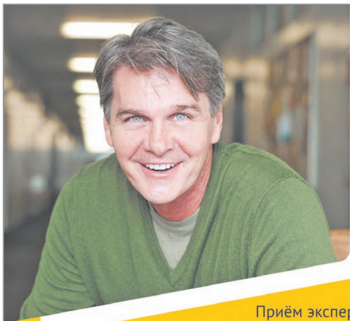
Приём эксперта и бесплатный тест слуха

Записывайтесь по адресу и телефону: +7 (4822)99-97-71, г. Тверь, Тверской п-т, д. 16.