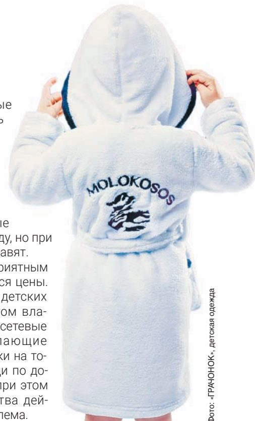
Фото: «ГРАЧОНОК», детская одежда

Отдельным приятным бонусом являются цены. Когда на рынке детских вещей в основном властвуют крупные сетевые магазины, делающие огромные наценки на товары, найти вещи по доступной цене и при этом хорошего качества действительно проблема.