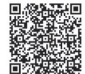
Видеосюжет смотрите здесь

– Тверская область – изумительный край, Тверь – прекрасный город. Мы обязательно сюда вернемся! Хочу пожелать всем мира и добра, – добавил он.