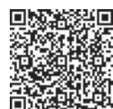
Фото и видеорепортаж смотрите здесь

В июне зрители увидят выставку «Тверь в графике русских художников XVIII – начала XX века», затем в графике – экспозиция ампирических часов XIX века в оранжерее Императорского дворца. В следующем году планируются выставки «Союза русских художников» и «Художники Удомельского края».