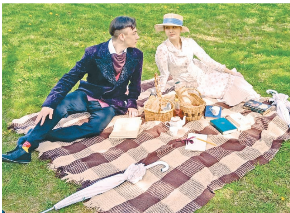
Фото: Усадьба Домотканово. Музей Валентина Серова ВК