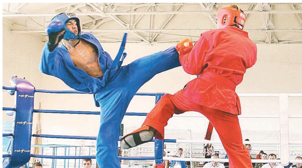
Победы на ринге мотивируют сотни мальчишек и девочек к занятиям спортом

– Ваши триумфальные победы на протяжении многих лет являются вдохновляющим примером для тысяч мальчишек и девочек Тверской области, занимающихся в спортивных школах и секциях. Атлеты продолжают великие тра-