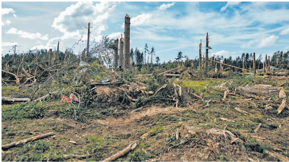
Ураган, который прошел в Андреаполе в 2021 году, – следствие глобального изменения климата на Земле