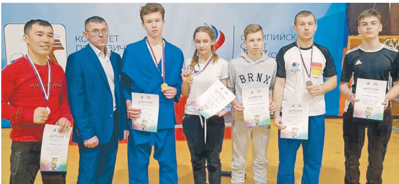
В Зубцове сложилась сильная школа единоборств

Зубцовские единоборцы задают высокую планку на международных соревнованиях