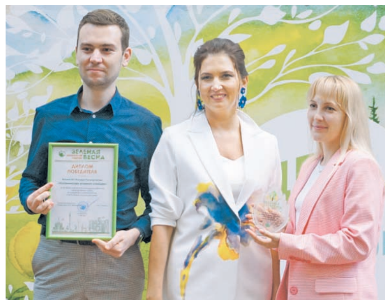
Калининская АЭС – победитель проекта всероссийского экологического субботника «Зеленая весна-2022»

Атомная станция реализует различные инициативы, направленные на возрождение культуры массовых субботников, объединение людей в деле защиты окружающей среды, содействие экологическому воспитанию и формирование культуры обще-