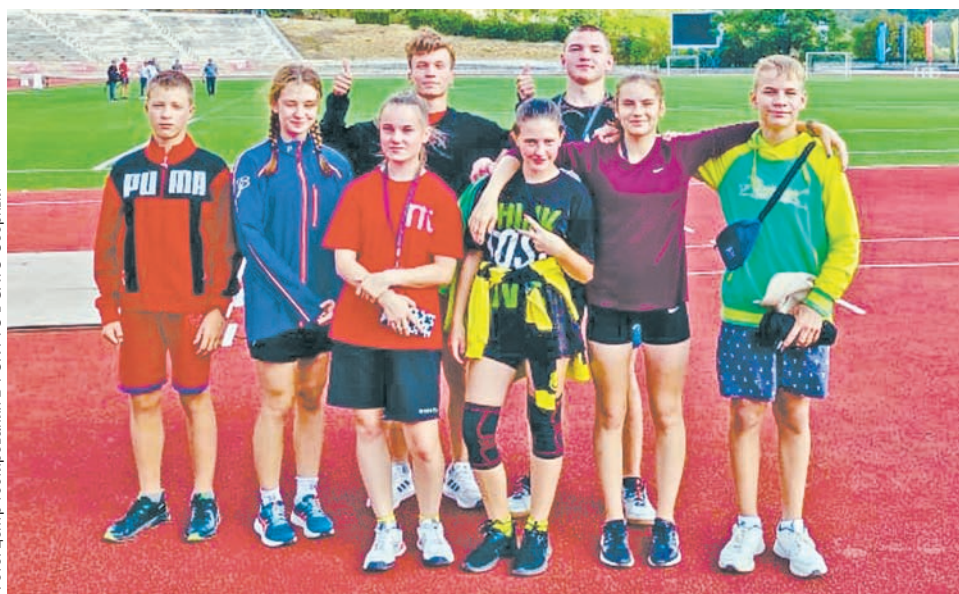
Ребята из Верхневолжья – обладатели золотых знаков – соревновались на фестивале ГТО в Артеке

Жители тверского региона семьями, секциями и трудовыми коллективами присоединяются к физкультурно-спортивному движению