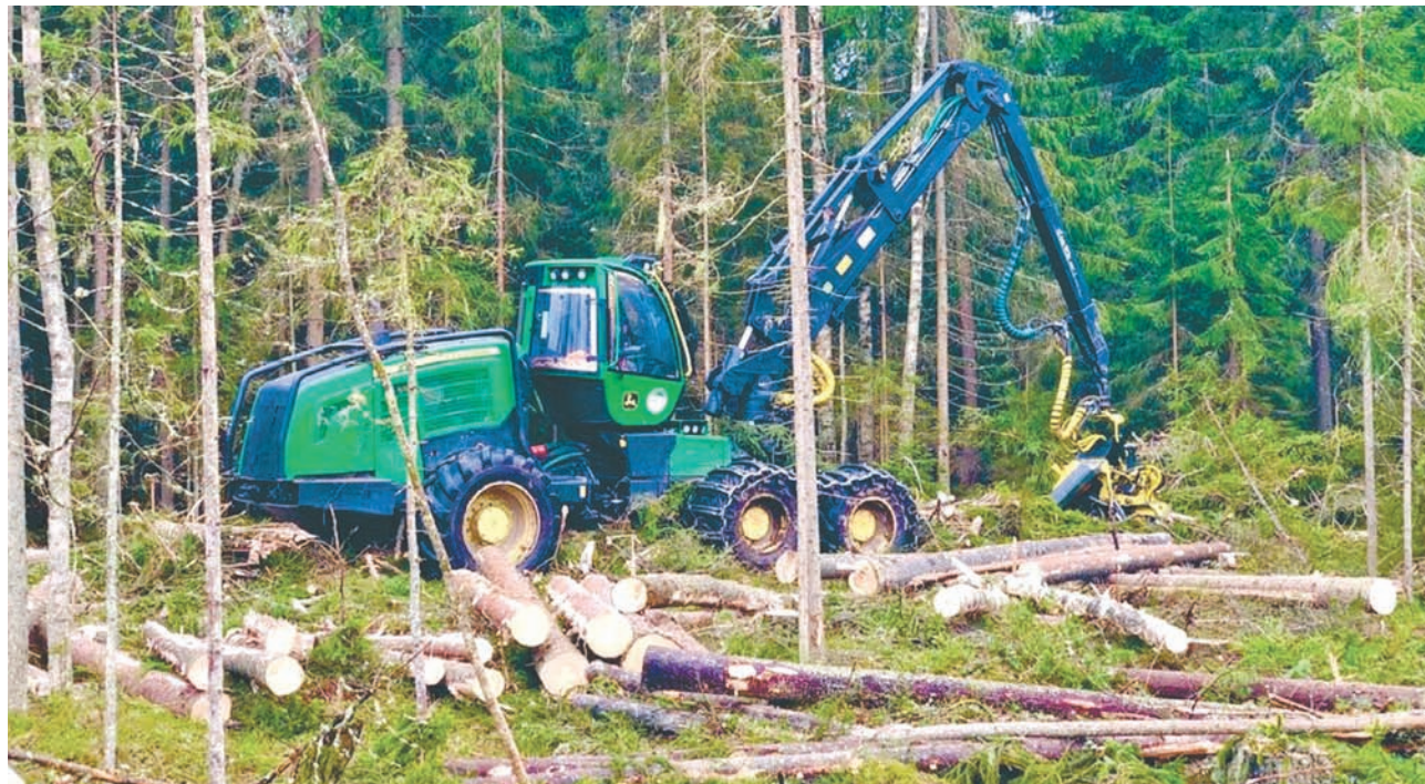
На лесосеках оставляются деревья с раздвоенными макушками, а также одиночные биотопы, которые сохраняются для гнездования птиц и поддержания биоразнообразия лесов

– Должно пройти не более двух лет после вырубки, чтобы на этом месте заложить новый лес. И прежде чем это сделать, необходимо подготовить делянку к посадке саженцев. Надо позаботиться и о посадочном материале. В этом году мы его закупили заблаговременно, несмотря на то что цены на саженцы с закрытой корневой системой дорожают почти в пять раз. Но надеемся, что наши расходы оправдаются, судя по отзывам, саженцы с закрытой корневой системой лучше приживаются. Мы их высадили на площади 11,5 гектара, для нас это первый опыт. Посмотрим, какой будет результат. После посадки необходимо обеспечивать