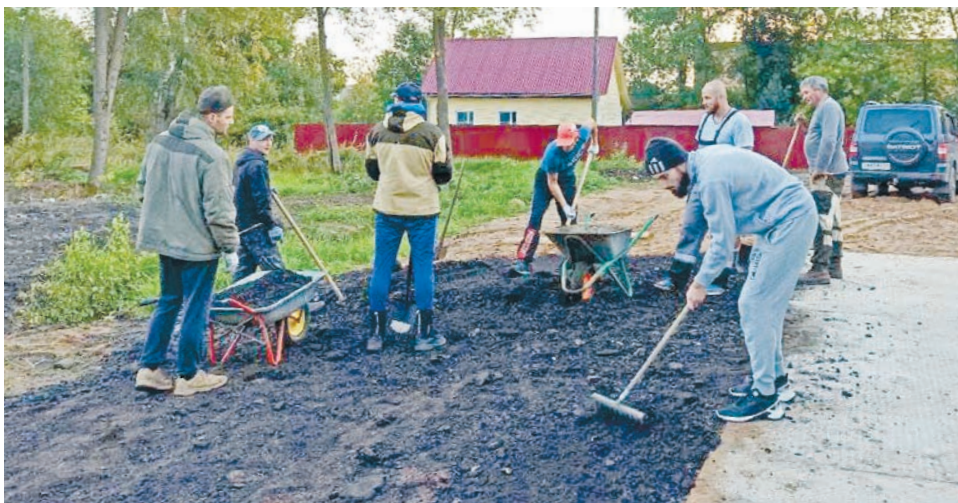
Инициаторы строительства лыжной базы проводят субботник на территории объекта

Проект обошелся почти в 1,7 млн рублей. Как обычно, собирали всем миром: здесь и средства депута-