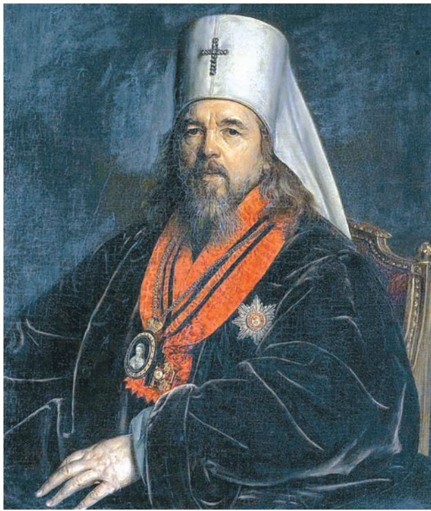
Митрополит Серафим, епископ Русской православной церкви

Серафим перекрестился и вышел из кареты. Задумало, в лицо била снежная пыль. Над Сенатской площадью кружила декабрь-