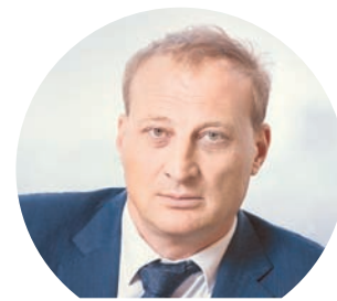
Леонид КАЗИНЕЦ , президент Национальной ассоциации застройщиков жилья, генеральный директор корпорации «Баркли»: