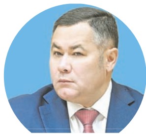
Игорь РУДЕНЯ , губернатор Тверской области:

На заседании регионального правительства, которое 20 июня провел губернатор Игорь Руденя , было принято решение увеличить финансирование ППМИ, благодаря чему в 2023 году дополнительно будут воплощены в жизнь еще 80 проектов. И теперь в списке инициатив, которые получают бюджетную поддержку, рекордное чис-