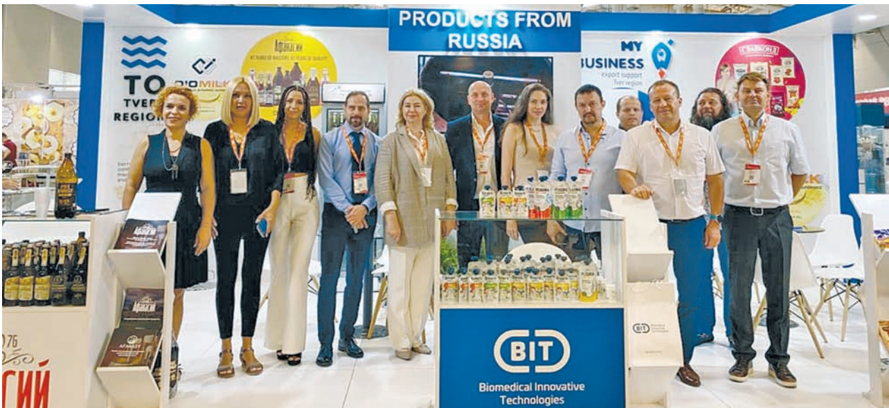
Выставка CNR Food Istanbul