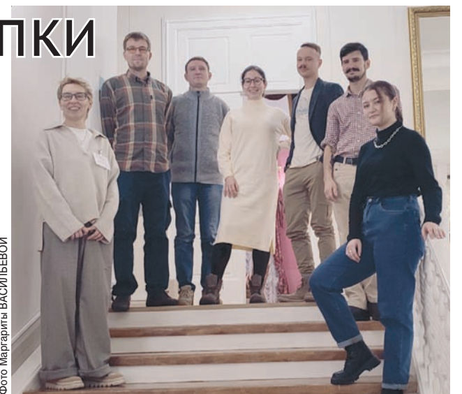
Археологи, участники раскопок

Планируется, что археологический парк будет включать в себя открытый раскоп, где любой желающий сможет почувствовать себя исследователем, выставочную площадку и арт-площадку. Открытое для посетителей хранилище: у каждой