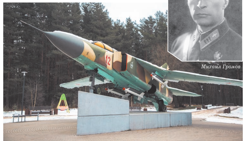
Памятник-истребитель МиГ-23 был установлен в сквере на пересечении улиц Громова и Гайдара.