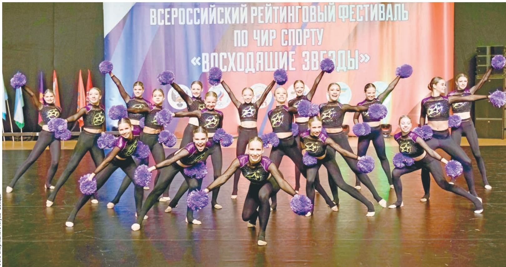
Фото спортивного клуба «Звезды»

И узнали, что в России уже проводятся не просто состязания между группами поддержки, а настоящие официальные соревнования по новому виду спорта – чирлидингу. Я стала интересоваться его историей, особенностями. В итоге в начале 2000-х в