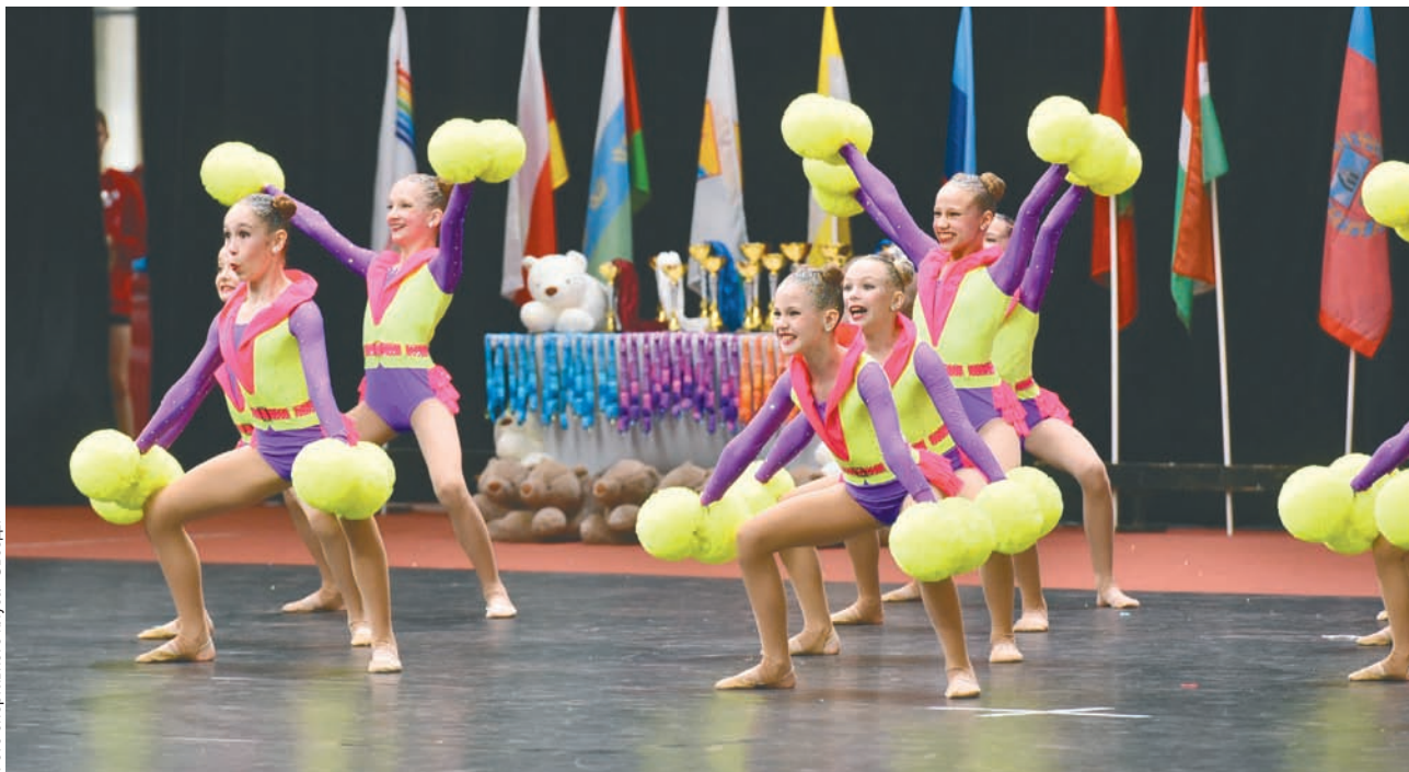
Фото спортивного клуба «Звезды»

сотни участников, десятки команд из разных уголков страны. Растет популярность чир спорта и за рубежом: на чемпионате в Китае выступали команды из Казахстана, Японии, США, Польши, Тайваня, Кореи и других стран. Популярность чир спорта, на мой взгляд, обеспечивает его зрелищность. А самим участникам он помогает проявить себя, воспитывает уверенность. В клубе «Звезды» сейчас занимается уже второе поколение спортсменок – наши воспитанницы первых наборов уже выросли и приводят заниматься своих дочек.