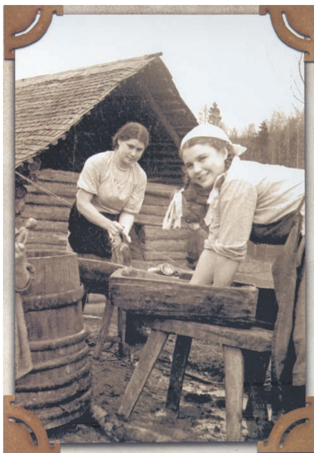
Комсомолки – фронтовые прачки. Калининский фронт, 1942 г.

Использование местного сырья, кустарное производство позволило слегка уменьшить товарный дефицит и поднять уровень жизни тыла.