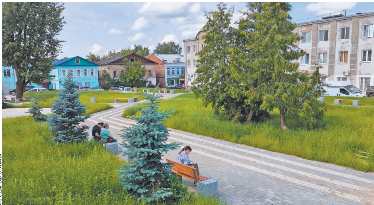
В Кимрах в прошлом году преобразилась Майская площадь

На все это по разным программам направили больше 1,1 млрд рублей. Причем вклад муниципалитетов составил всего 107 млн рублей, это десятая часть от общих вложе-