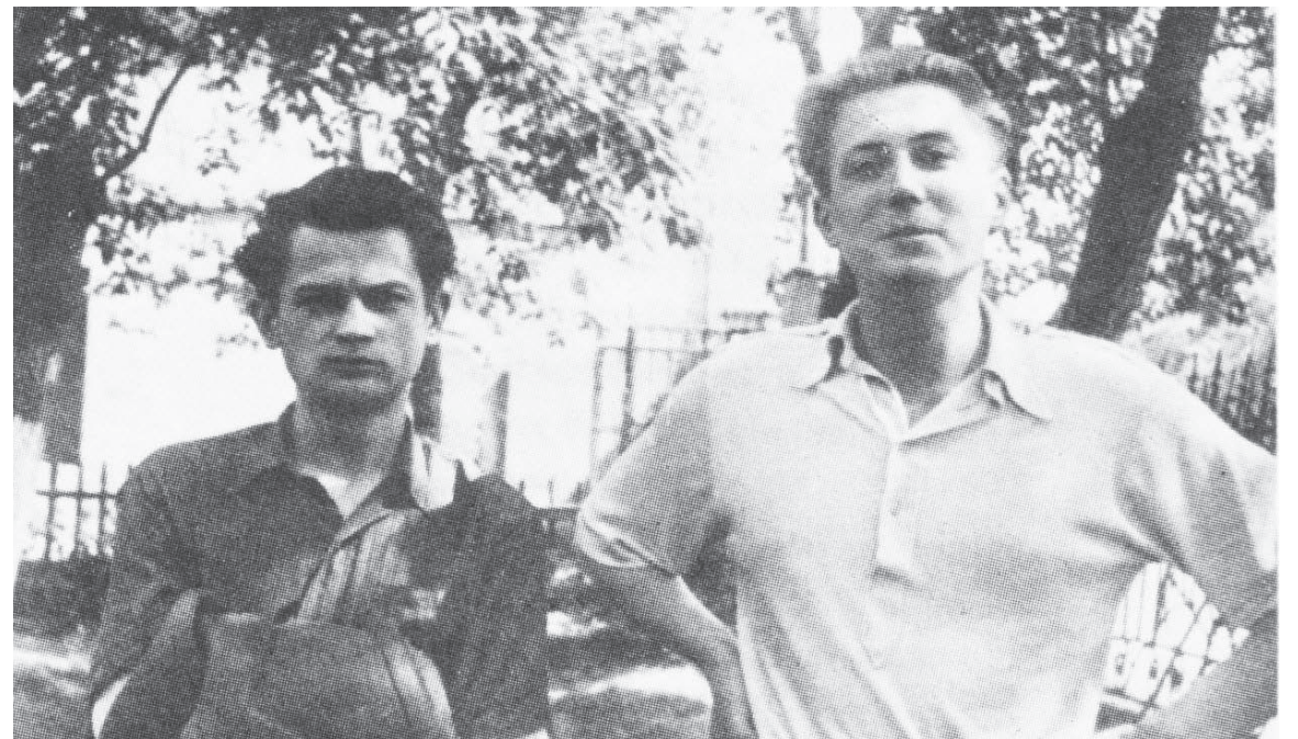
С Евгением Евтушенко. Студенческие годы

Прекрасная необычайность Обыденного — хороша... Ведь это чистая случайность, Что ты живешь, что есть душа. Все это маленький подарок, Который так легко отнять, Который, может, тем и яркое, Что может даже не сиять.