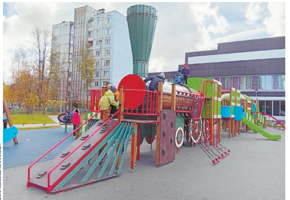
На Городской площади в Конаково установили детский игровой комплекс, который стал местом притяжения для ребятнишек

Четыре проекта реализуют в областной столице: продолжится работа в скверах на улице Артюхиной и проспекте Корыт-