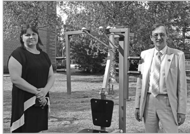
Новые тренажеры открыты для всех желающих

С нетерпением начала занятий здесь ждут еще и потому, что можно будет заняться техническим моделированием. В феврале в Оленинской СОШ по нацпроекту «Образование» открыли центр прототипирования и программирования, получив на это миллионный грант. Теперь здесь есть все для 3D-моделирования и печати: два ноутбука с высокой производительностью, компьютер, три 3D-принтера разного формата, 3D-ручка, программ-