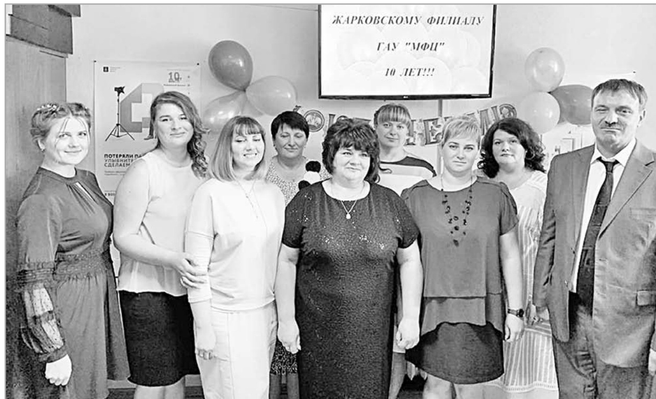
Все сотрудники Жарковского МФЦ работают со дня его основания

Сотрудники Жарковского МФЦ первыми осва-