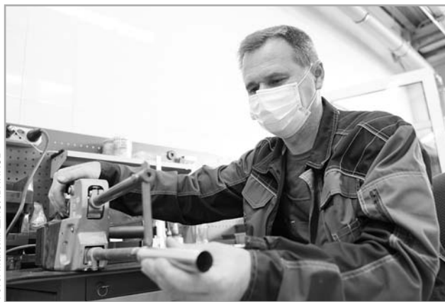
Оборудование из Кимр не подводит даже в экстремальных условиях

Машины, которые выпускает «Геосвип», нигде в России больше не делают. И все инженерные и конструкторские решения уникальны, используются только для российской техники. В стране сегодня гигантская потребность в модернизации, техническом перевооружении промышленности, в том числе такими машинами, которые делают на «Геосвипе». Поставлена задача обеспечить такой техникой всю нефтегазовую отрасль.