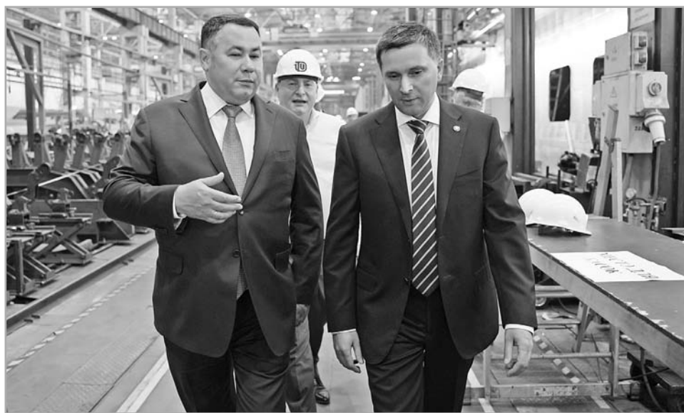
Игорь Руденя показал Дмитрию Кобылкину успешные тверские предприятия

Дмитрий Кобылкин с Игорем Руденей не только посетили тверские предприятия, но и обсудили ряд актуальных для региона