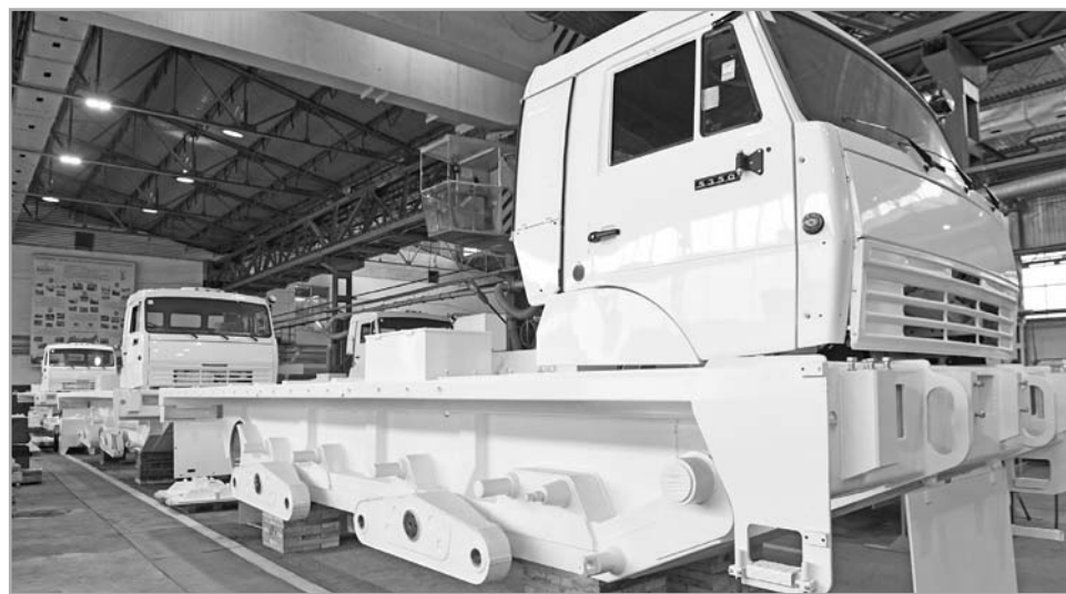
В сборочном цехе «Геосвипа» собирают пять машин для нефтеразведки в условиях Крайнего Севера

На тверском предприятии производят уникальные машины для разведки недр, используя инженерные и конструкторские решения собственной разработки