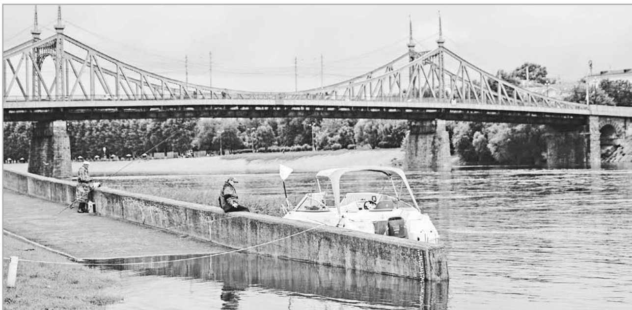
Глава региона обсудил с министром экологии программу оздоровления Волги

Так, и сортировка отходов, и регулярная оплата коммунальных услуг помогают сделать регион чище.