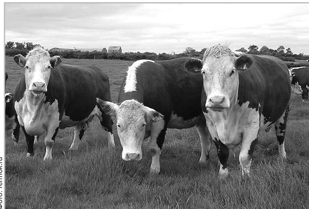
Геррефордская порода – перспективное направление мясного животноводства

К слову, оформлять документы на предоставление субсидий не так и сложно, подавать заявку сельхозпроизводители Тверской области могут через местные МФЦ. Там добавлены услуги по предоставлению областных субсидий на стимулирование повышения продуктивности в молочном скотоводстве, на возмещение части затрат при производстве молока и на возмещение затрат за произведенное и реализованное мясо кроликов. В региональном минсельхозе сообщили, что на принятие решения по каждой заявке уходит не больше 15 дней.