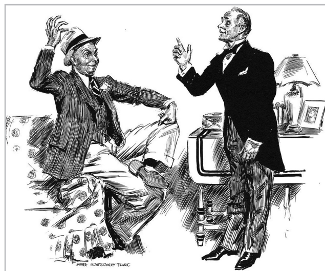
Американским адвокатам не удалось вернуть деньги своих клиентов

Дело оказалось для того времени показательным. Настолько показательным, что в последние