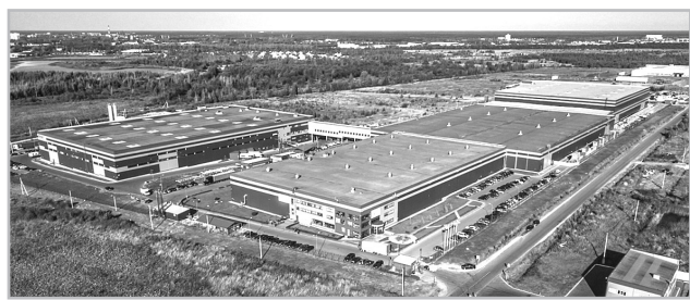
Технопарки обеспечивают благоприятные условия для реализации инвестиционных проектов

Участки в технопарке в Твери будут предоставляться инвесторам бесплатно без торгов