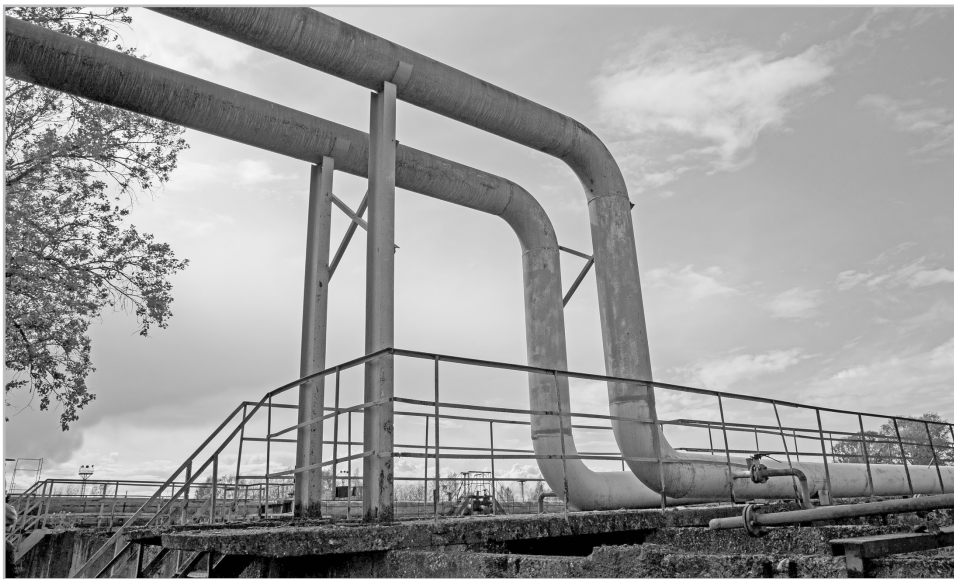
Реконструкция водозабора: сегодня в Твери, а завтра – в Ржеве