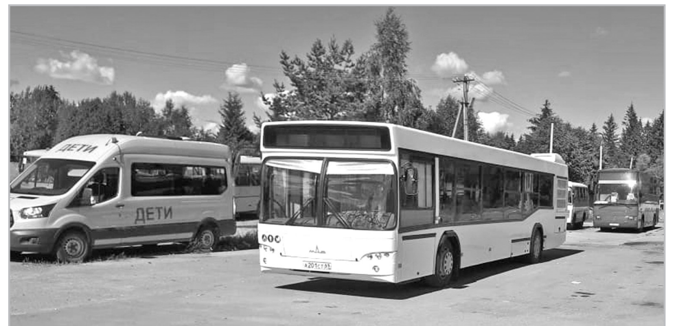
Льготный кредит помог обновить автопарк

Реализуется региональная программа поддержки бизнеса и промышленных предприятий. Для более чем 7400 субъектов малого и среднего бизнеса в три раза снижены размеры налоговых ставок по упрощенной и патентной системам налогообложения.