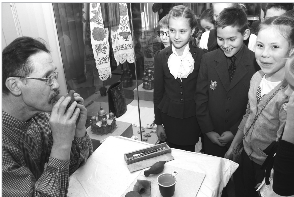
В туризме продлено субсидирование для возмещения затрат при организации турпоездок школьников по Тверской области

► Региональный фонд содействия кредитованию МСП выдал 187 займов на сумму 346,9 млн руб. Микрозаймы выдаются на льготных условиях, став-