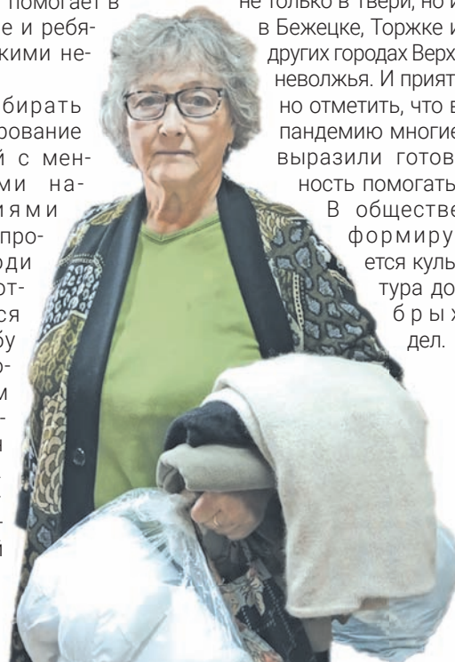
«Фонд Твери» регулярно оказывает гуманитарную помощь пожилым и малоимущим – через проект «Добрый шкаф»

не только в Твери, но и в Бежецке, Торжке и других городах Верхневолжья. И приятно отметить, что в пандемию многие выразили готовность помогать. В обществе формируется культура добрых дел.