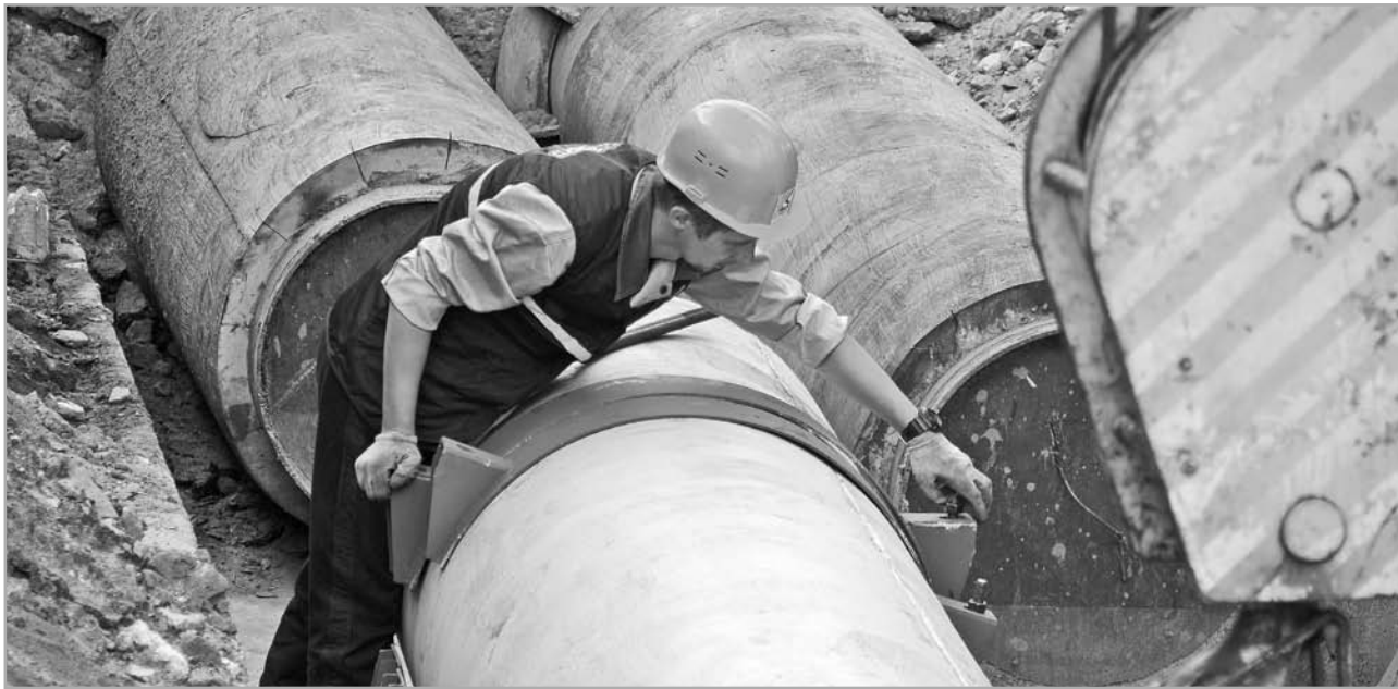
Модернизация коммунальных сетей позволяет избежать крупных аварий

Игорь Руденя первые два года после того, как возглавил регион, каждую зиму по несколько раз выезжал на крупные прорывы и аварии в коммунальном хозяйстве. Тогда стало ясно, что непонятные фирмы, собирающие деньги с жильцов, за ресурсы по несколько лет не платили от слова «совсем», а инте-