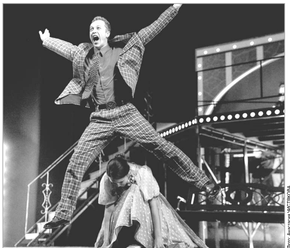
Момент из спектакля Тверского театра драмы «Осторожно, любовь!»

– Часто современные актеры жалуются, что в спектаклях присутству-