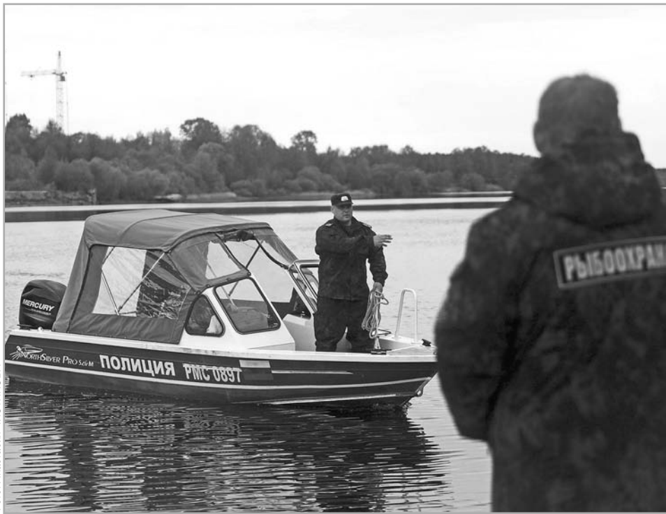
Зарыбление Волги мальками стерляди проводится в рамках контракта, подписанного в 2018 году на Петербургском международном экономическом форуме

Зарыбление проводится совместно с Московско-Оским территориальным управлением Росрыболовства, Главным бассейновым управлением по рыболовству и со-