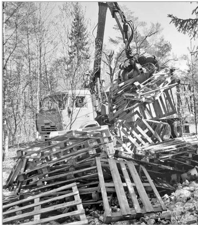
В мае ТСАХ ликвидировал стихийную свалку за деревней Лебедево, где какой-то предприниматель регулярно вывозит поддоны и просроченную продукцию

– С рядом муниципалитетов ведется конструктивный диалог. Это Осташков, Андреаполь, Зубцов,