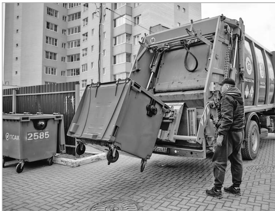
Для повышения качества услуги по вывозу мусора были закуплены новые машины и контейнеры

Одна из причин возникновения свалок – незаконное захоронение мусора в лесах, на обочинах дорог, в населенных пунктах, где раньше производился пакетированный сбор, теперь организованы места для накопления твердых коммунальных отходов. Напомним, что организация, обустройство контейнерных площадок – полномочия муниципалитета. Региональный оператор предоставляет необходимое количество контейнеров