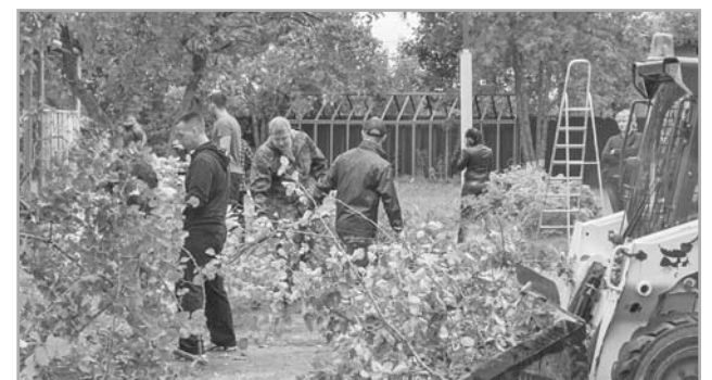
В ходе субботника от мусора очищены территории школ и детских садов, обрезаны сухие ветки деревьев и кустарников

городского округа, Калининской атомной станции, всех жителей округа неразрывно связаны. Только совместными усилиями можно сделать округ лучше, красивее и двигаться по пути развития и созидания. В самом ближайшем будущем у каждого