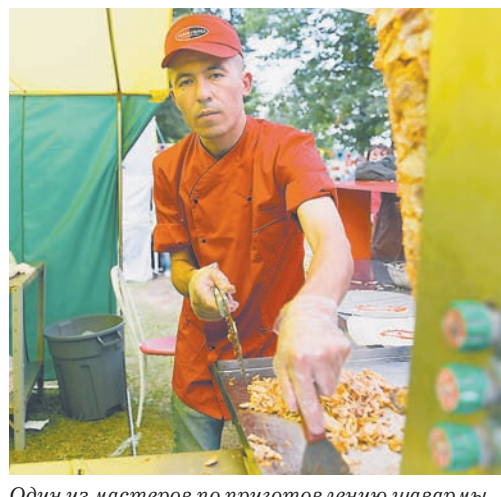
Один из мастеров по приготовлению шавармы, к которому выстроилась самая большая очередь