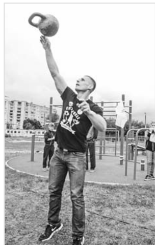
Стать сильнее, повысить общий уровень выносливости организма – не единственные цели спорта. Он научит ребенка основному – системности, дисциплине

Вы можете высказать свое мнение по теме номера на сайте «Тверских ведомостей» www.vedtver.ru , рубрика «Тема номера»