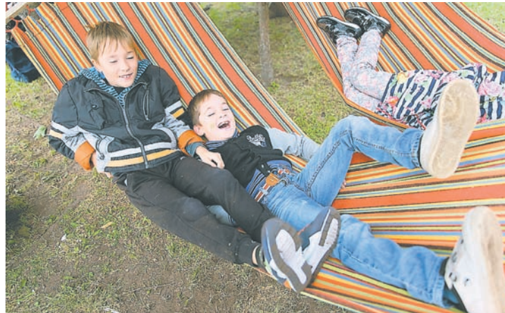
После вкусных угощений можно было отдохнуть, лежа в гамаке