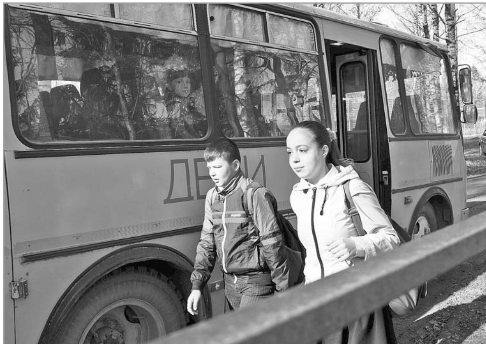
На территории Верхневолжья организован ежедневный подвоз почти 10400 учащихся, проживающих в сельской местности

Продолжается создание доступной среды для комфортного пребывания учащихся с ограни-