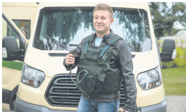
Взрослые с удовольствием осматривали банковскую машину и примеряли форму инкассаторов