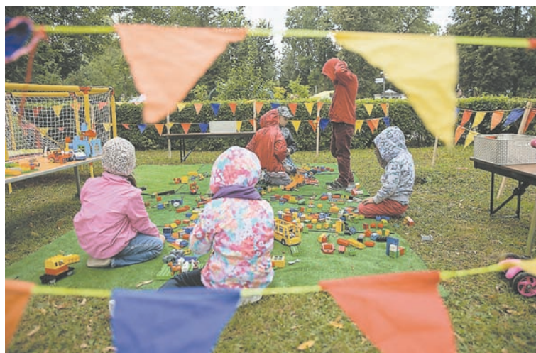
Для детей была предусмотрена отдельная площадка