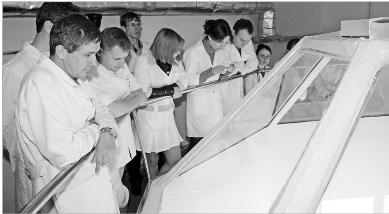
Внимание: идет операция на открытом сердце!

Молодые врачи тогда посетили музей здравоохранения Тверской области, который еще только готовился к открытию, поэтому они стали первыми посетителями. Медики оставили послание, в котором рассказали о себе. Оно должно будет вскрыто в 2024 году теми, кто придет уже после них, посвятив себя одной из самых благородных профессий.