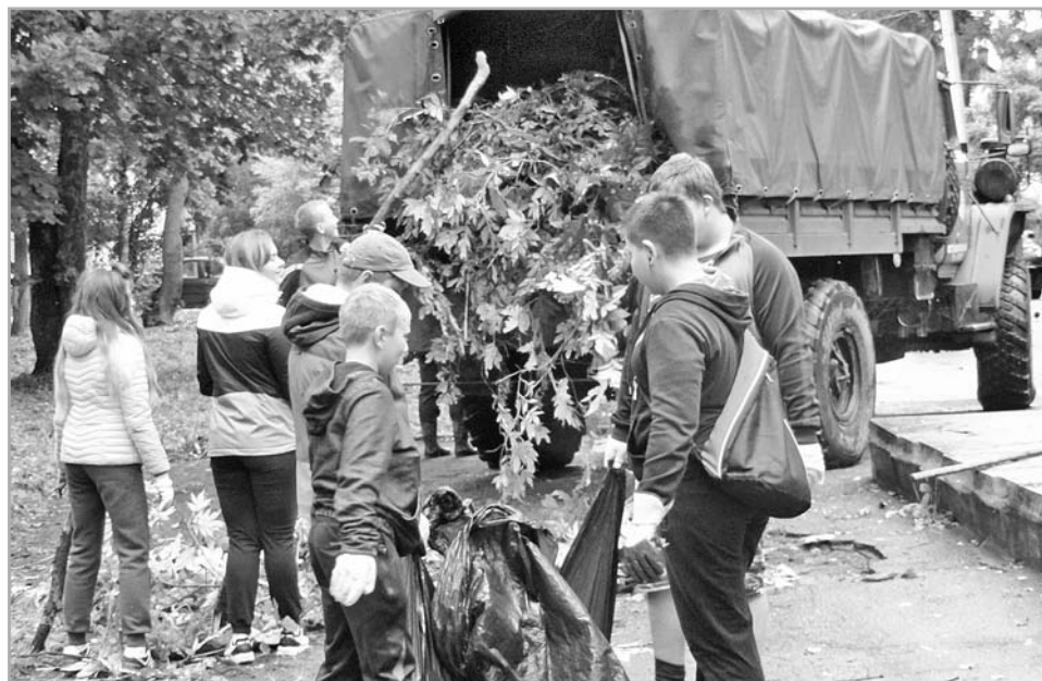
К началу учебного года убрана и территория, примыкающая к колледжу

Однако, рассказал член Совета Федерации, серьезной задачей остается обеспечение района врачами с профильными специальностями. Впрямую меры для решения кадрового вопроса планомерно