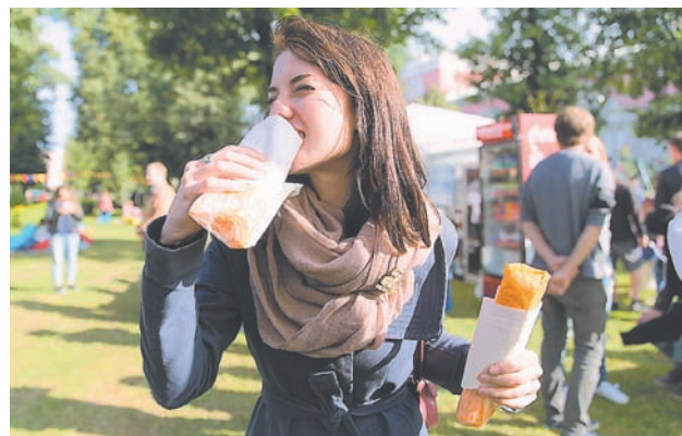
Самые голодные закупились сразу несколькими шавармами