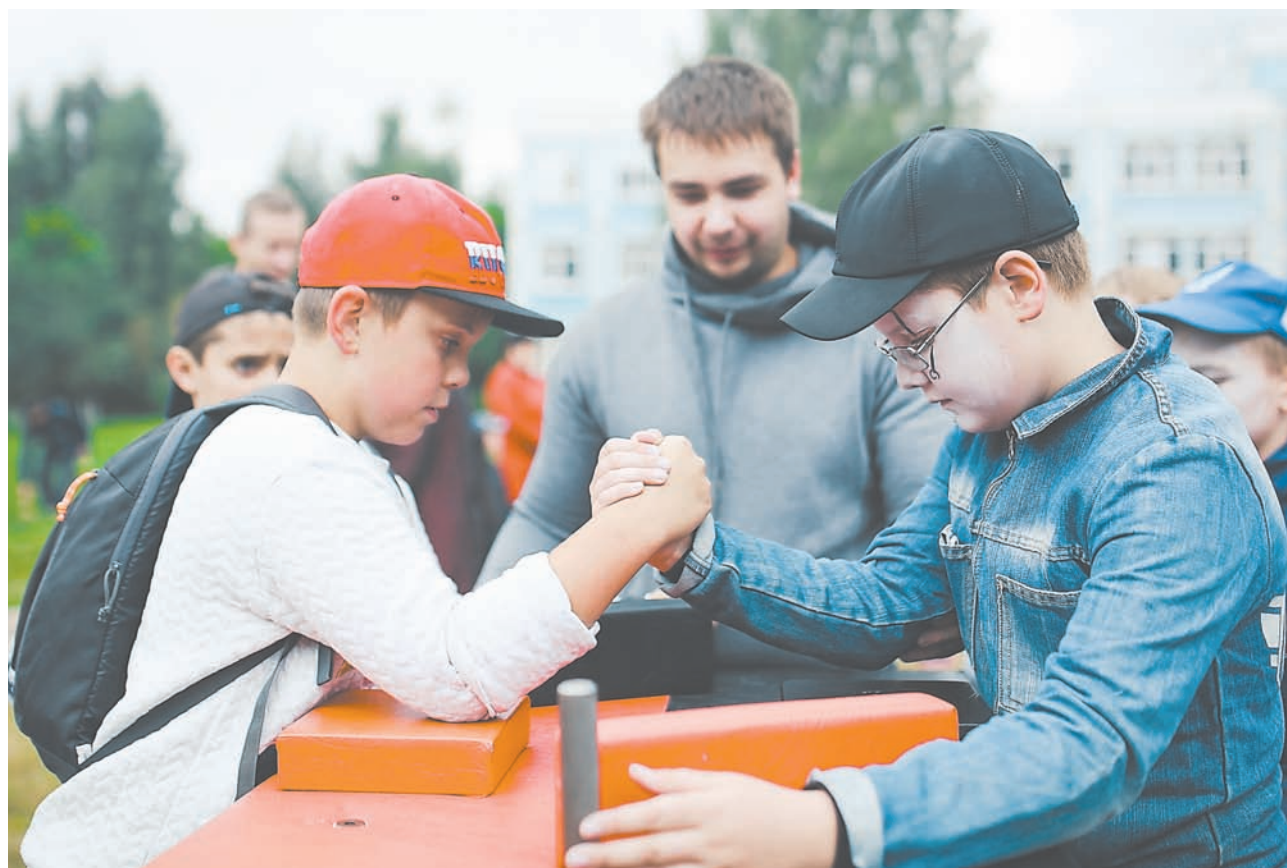
Детей разного возраста ждут на занятия 10 государственных спортивных учреждений. Среди них есть как комплексные школы, так и специальные. Диапазон выбора секций широкий!

Родители вместе с детьми принимают решение, которое может стать судьбоносным: грядет единый день регистрации в спортивные секции