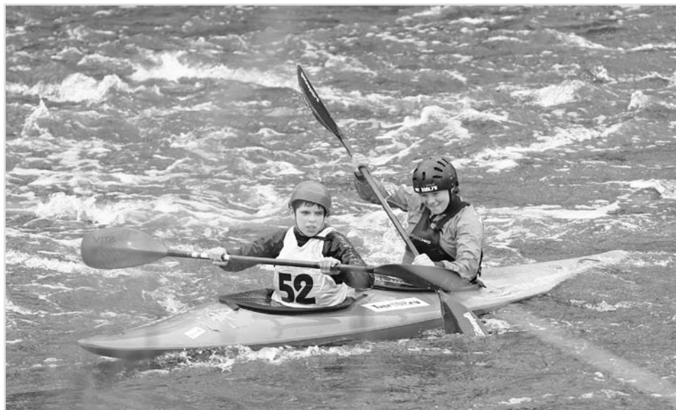
Не важно, какой именно вид профессионального или любительского спорта выберет ребенок. Главное, заниматься тем, который нравится