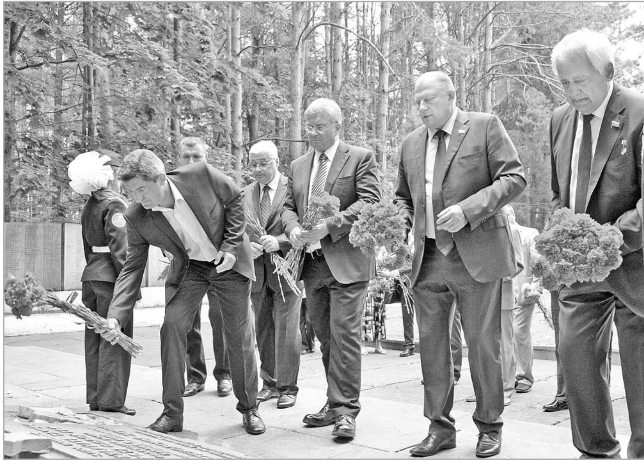
К траурным плитам мемориального комплекса были возложены цветы

Жители Зубцова отметили 75-ю годовщину освобождения от немецко-фашистских захватчиков