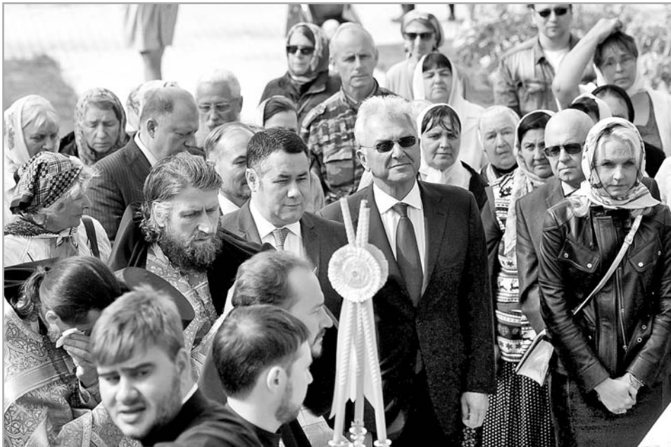
Виктор Христенко вместе с председателем Счетной палаты РФ Татьяной Голиковой ежегодно посещает праздник в Старице

– Новый учебный год – это новый этап в жизни юных жителей Тверской