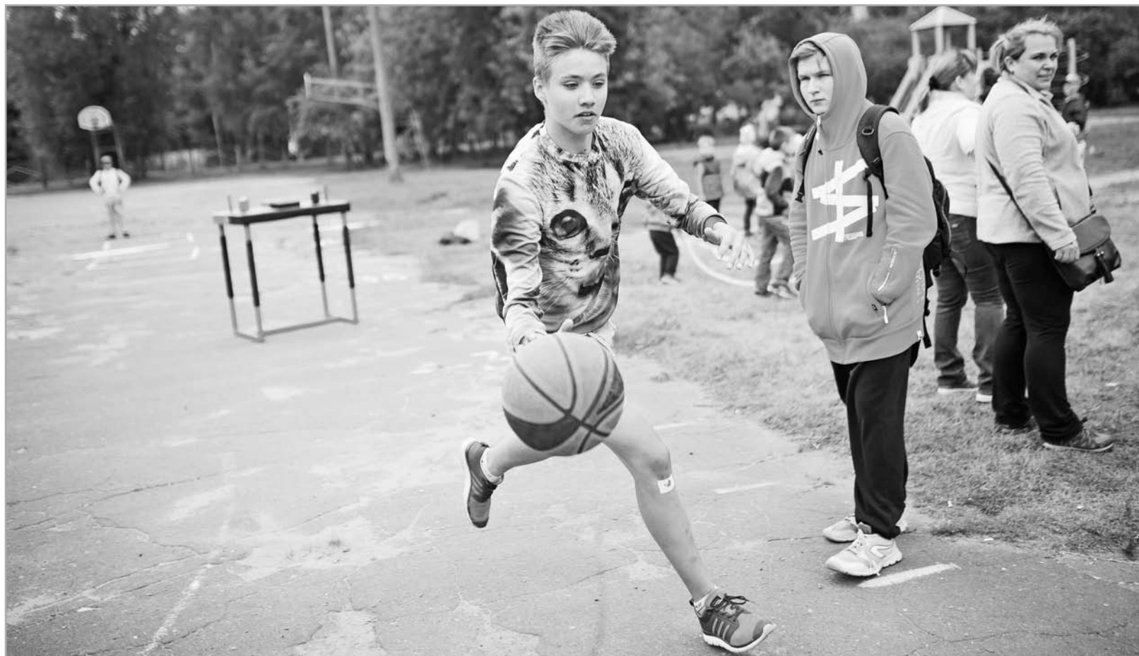
Многие, кто придет 3 сентября в «Юбилейный», уже определились с выбором. Прийти к спорту, полюбить его тверским детям помогает проект «Дворовый тренер». Это бесплатные тренировки по волейболу, баскетболу и воркауту, проходящие в разных районах города

Родители вместе с детьми принимают решение, которое может стать судьбоносным: грядет единый день регистрации в спортивные секции