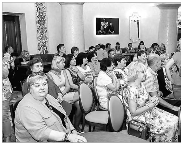
Планов на грядущий 272-й театральный сезон у труппы много

Но, несмотря на грустные события, планов много. Грядущий 272-й сезон будет наполнен премьерами.