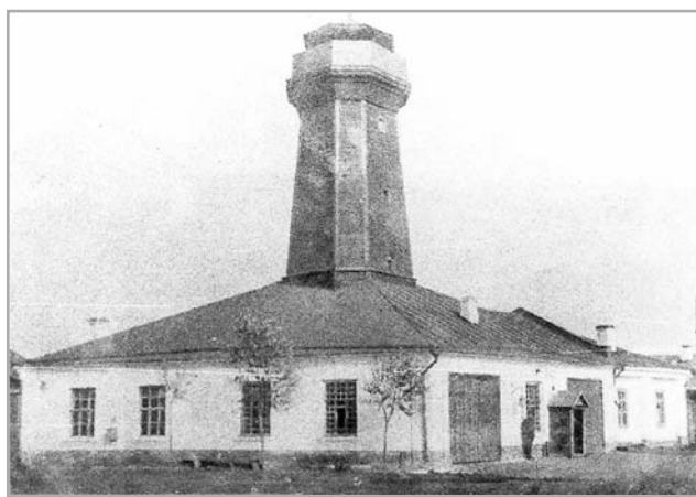
Это было первое пожарное депо в городе Твери

Первоначальное название площади – «Съезженская» – от «съезжего» полицейского дома, после строительства рядом с которым в 1907 году пожарного депо название