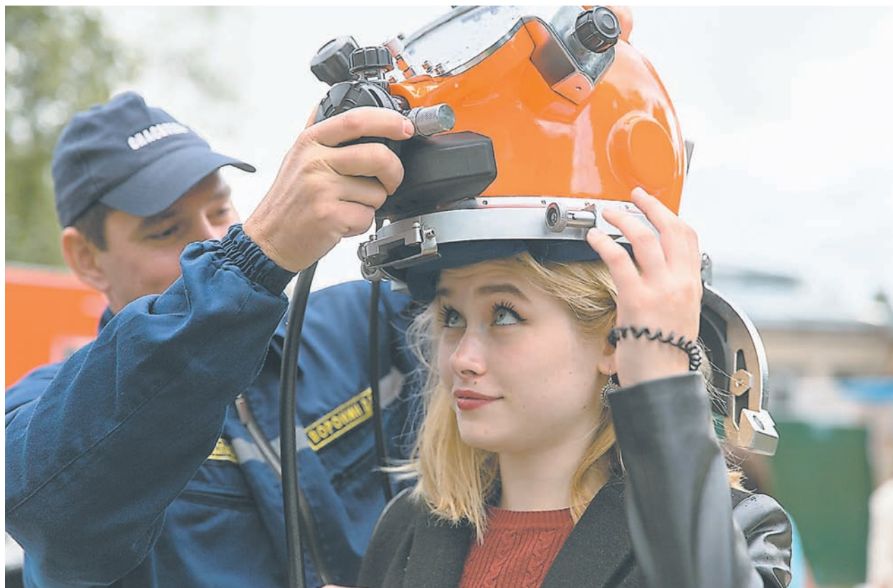
Гости фестиваля смогли надеть на себя новейшие костюмы спасателей, которые есть в МЧС

Отдельно следует отметить и площадку муниципального унитарного автотранспортного предприятия «ПАТП № 1», где не только продавали карты «Иволга», а привезли также раритеты из музея. По словам организаторов, посетителей было много. Самые любопытные задавали свои вопросы оператору по расширению функционала. Но более интересным здесь, конечно, был троллейбус 1952 года выпуска. Тверитяне не упустили шанс сфотографироваться с раритетом, а также посидеть в кабине. Приходили сюда и работники бывшего трамвайно-троллейбусного предприятия – поностальгировать.