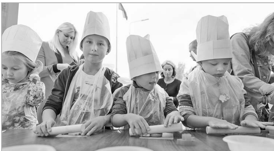
Специальную программу, в том числе кулинарный мастер-класс, организовали для детей

Рестораны, которые принимали участие в фестивале, разработали меню, в котором были представлены и другие традиционные блюда региона. Как уточняют в администрации города, готовили их из продуктов местного производства.