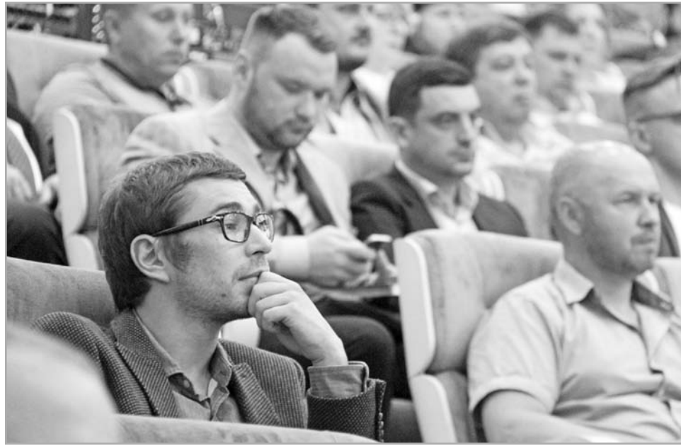
Интересы предпринимателей на встрече представили пять проектных групп по разным направлениям

Около 400 предпринимателей Тверской области обсудили с губернатором экономику региона