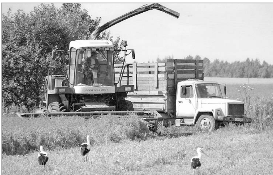
Улучшать ежегодные показатели в растениеводстве и животноводстве помогает планомерная модернизация

На очереди другая важная для аграриев дата – День сельского хозяйства, который отмечается в России 11 октября. Он снова пройдет в ДК в торжественной обстановке, и самые лучшие работники отрасли получат заслуженные награды и премии от колхоза. А через год еще одна важная дата – осенью 2021 года колхозу исполнится 90 лет. И это будет масштабный праздник не только для сотрудников коллективного хозяйства «Мир», но и Торжокского района и Верхневолжья в целом.