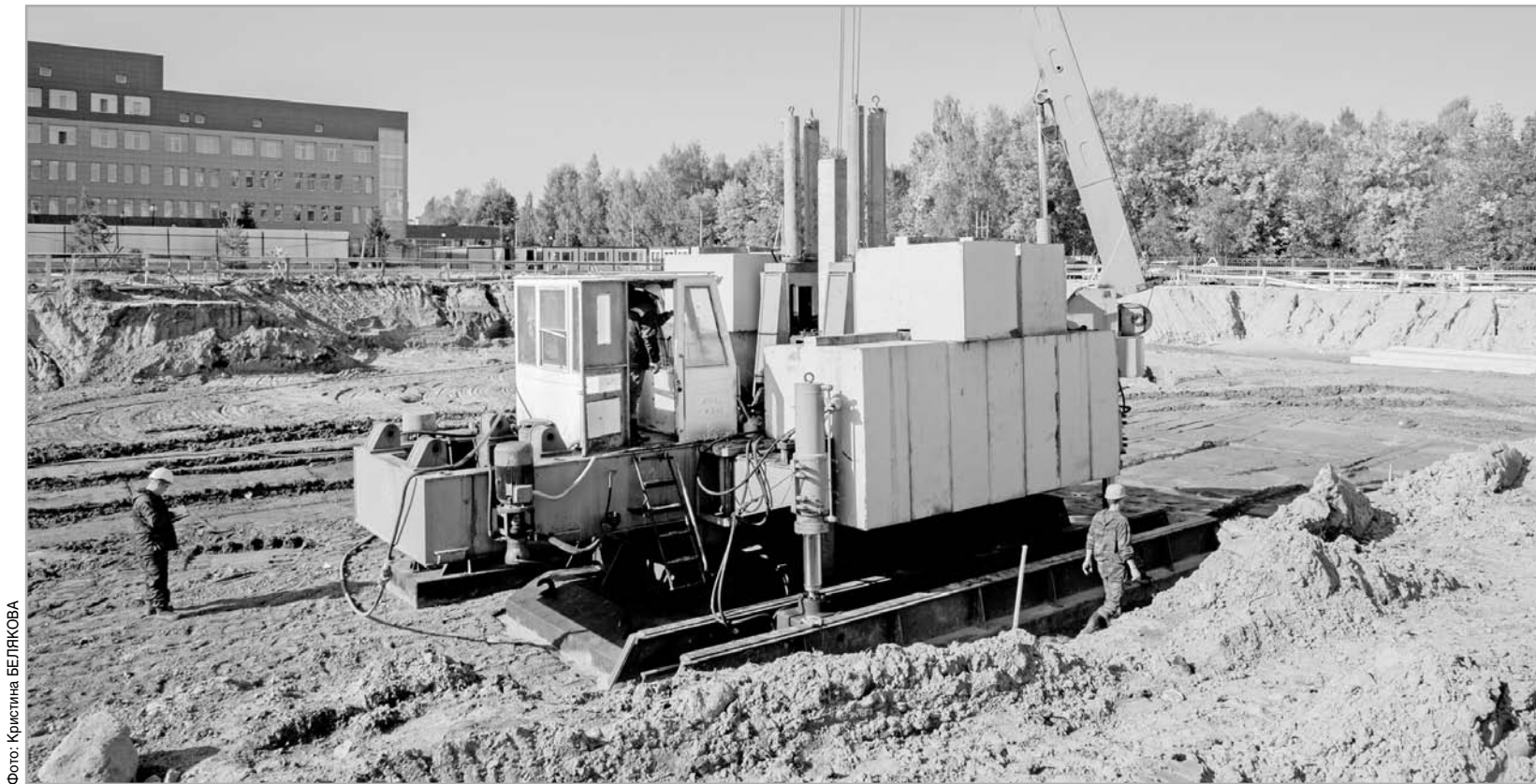
В Твери идет строительство новой областной детской больницы

В экономике есть такое понятие – институци-