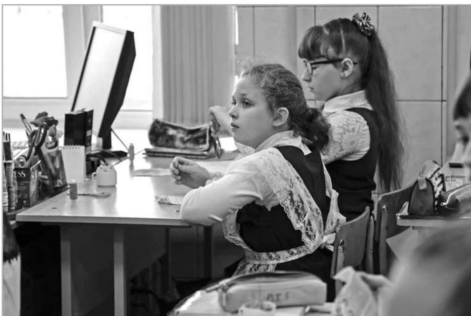
Вступили в действие поправки к закону «Об образовании», в которых предписывается не только образование, но и воспитание

Впервые в заседании Координационного совета принял участие митрополит Тверской и Кашин-