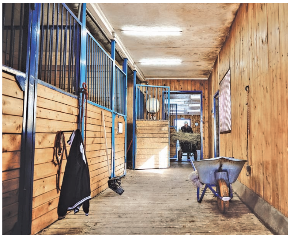
Конюшня должна всегда содержаться в образцовом порядке

Если животное не желает тренироваться, его ни уговорами, ни силой не заставишь. Чем больше будешь пытаться заставить лошадь делать то, что ей не нравится, тем сильнее сопротивление. Не секрет, что у каждой лошади свой характер. Если ей не по нраву занятия, то и не надо ее пытаться сделать спортсменкой. Конный спорт – это парный спорт, и важно, чтобы между лошадью и наездником было полное взаимопонимание.