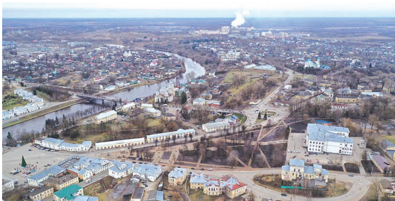
В 2019 году в Торжке провели реновацию «Парка культуры и отдыха»

Результаты получены на основании расчета Минстроем России совместно с ДОМ.РФ индекса качества городской среды по итогам 2019 года. Оценивались несколько позиций: развитие городских пространств, озеленение, дорожная, социально-досуговая и об-