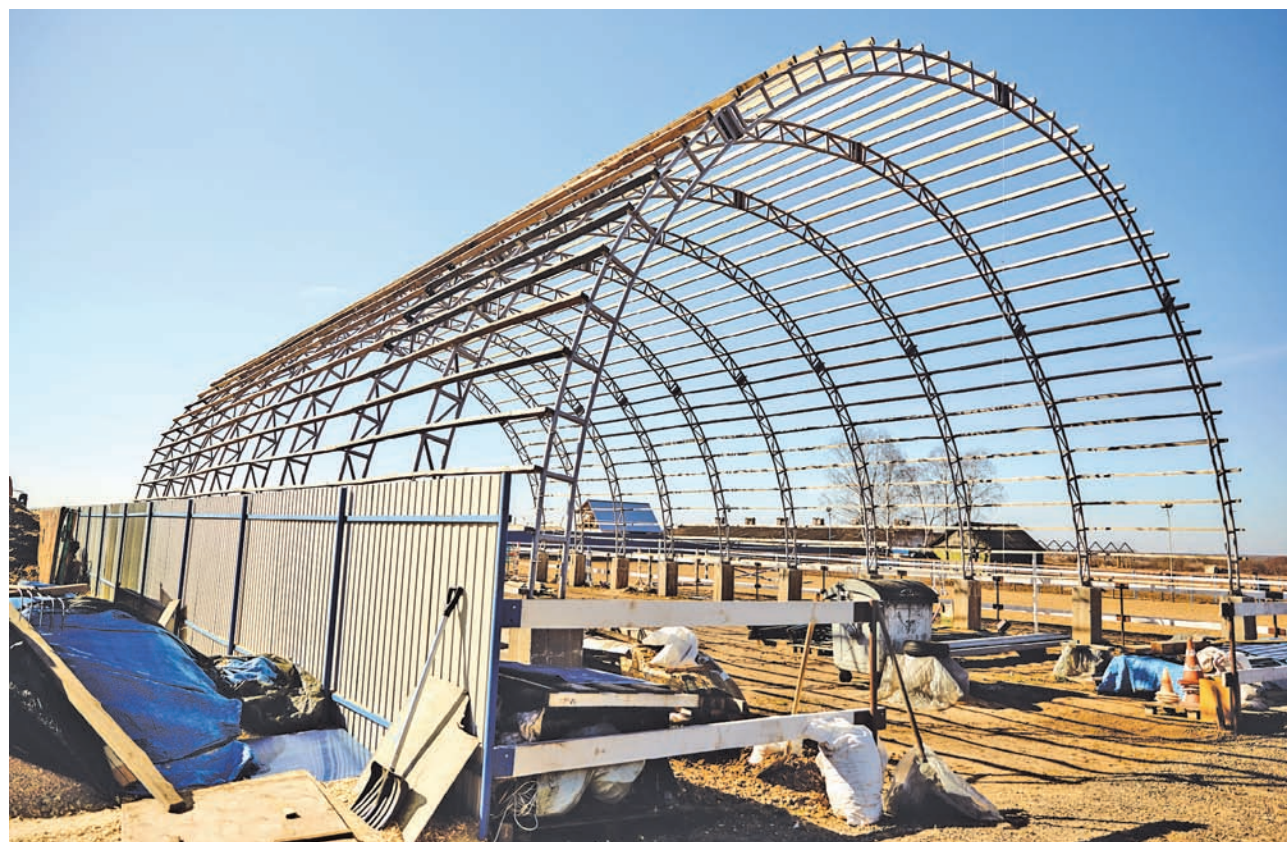
После окончания строительства манежа появится возможность тренироваться при любой погоде