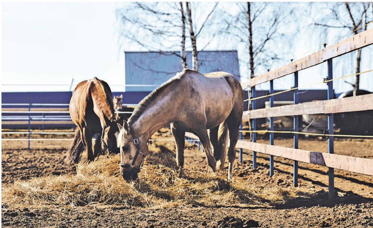
Свежий воздух полезен всем