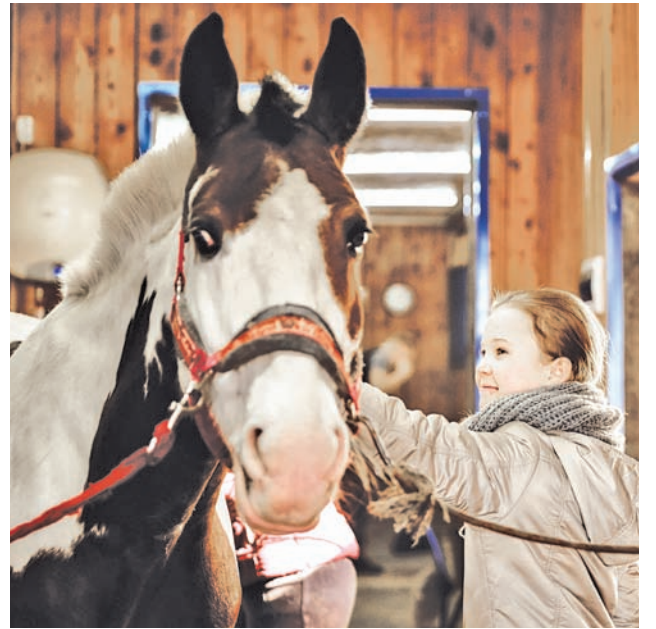
Психологи считают, что общение с лошадьми детям идет на пользу