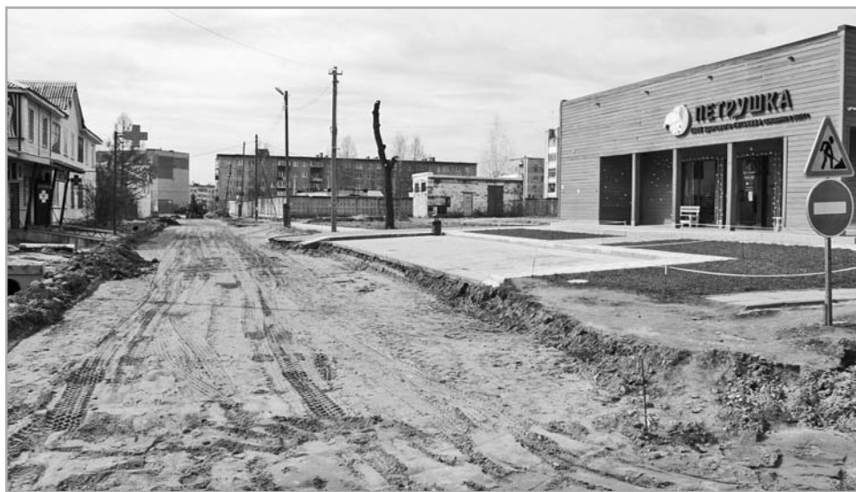
Ремонт пер. Куйбышева