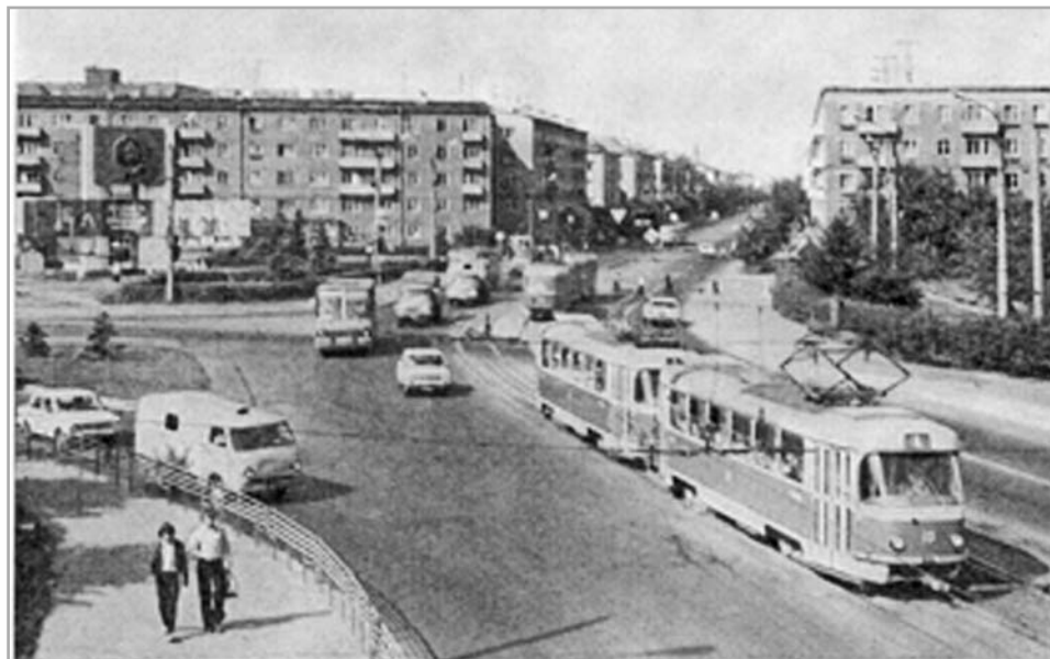
Так выглядела площадь Конституции в начале 1980-х годов