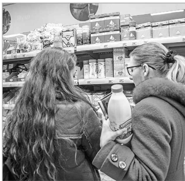
Современные стандарты, в отличие от советских ГОСТов, используются производителями на добровольной основе. Несертифицированную продукцию покупатель выбирает на свой страх и риск

– Прежние ГОСТы ставили производителей в очень жесткие рамки технических нормативов, установленных сверху, государством, – поясняет директор территориаль-