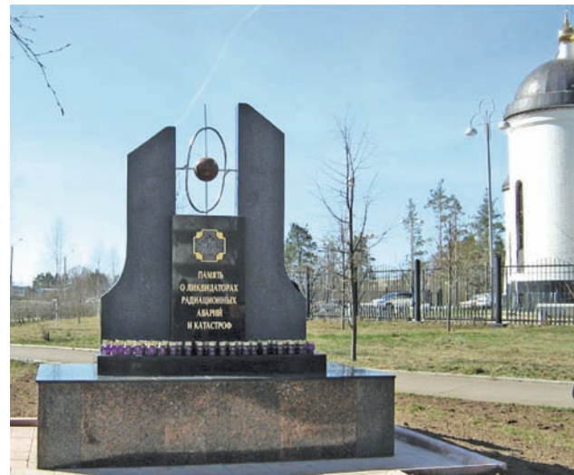
В этом году завершат благоустройство парковой зоны по улице Венецианова в Удомле

бюджета выделят порядка 225 млн рублей. Финансы распределяют между девятью городами Тверской области с населением свыше 20 тыс. человек, где проводилось голосование жителей по выбору объектов благоустройства.