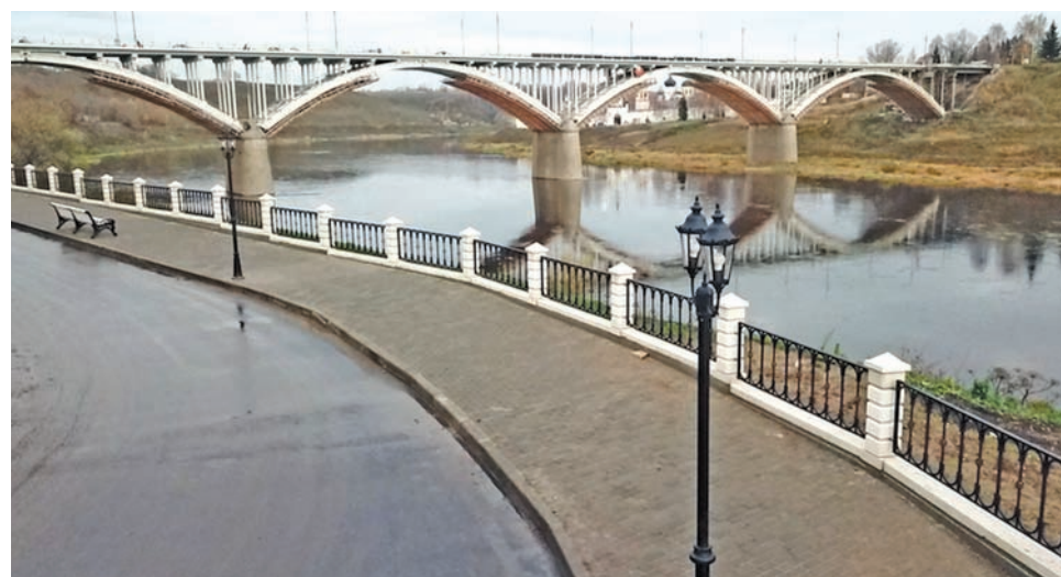
Набережная Волги в Старице преобразилась

Предусмотрено создание прогулочных маршрутов, велосипедной сети, освещения. Здесь появятся новые спортивные площадки для занятий футболом и пляжным волейболом, будет создана зона для воркаута и детская площадка.