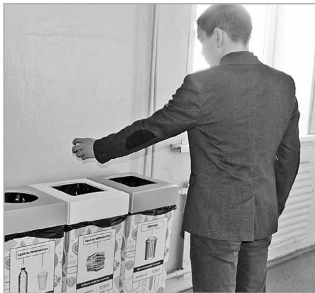
В тверской гимназии № 12 уже установили контейнеры для раздельного сбора отходов

Однако считать, что в сфере экологического образования и просвещения сделано все возможное, конечно же, преждевременно. Поэтому значительная часть заседания была посвящена не констатации достижений, а выявлению того круга проблем, на решении которых необходимо сосредоточить внимание всех, кто озабочен состоянием окружающей среды. Прежде всего – и это касается не столько молодежи, сколько людей взрослых – необходимо воспитывать общую экологическую культуру. Воспитывается точно так же, как воспитывается уважение к родителям, любовь к родной земле, культура поведения в общественном месте и другие этические нормы. Готово ли наше сегодняшнее общество включить экологическую культуру в сферу своих поведенческих стереотипов – этот вопрос неоднократно звучал в ходе обсуждения. Мнения разделились от крайнего пессимизма («законы экономики сильнее общественного блага и в борьбе экологии и промышленного производства побеждает тот, кто сильнее») до оптимистичного прогноза, который наглядным примером