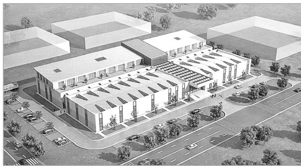
Так будет выглядеть технопарк «Боровлево-3»

онах, продолжает потихоньку реализовываться так называемая мусорная реформа, призванная минимизировать объем сва-