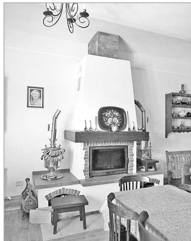
В селе Замытье работает чайная, да непростая, так как оформлена в старинном стиле: с камином, самоварами и музыкальными инструментами вплоть до гуслей

В настоящее время еще много семей ждут помощи. Подробнее смотрите информацию на официальном сайте благотворительного фонда «Константа». Также можно отправить на короткий номер 3443 SMS со словом «константа», поставить пробел и написать цифрами сумму пожертвования.