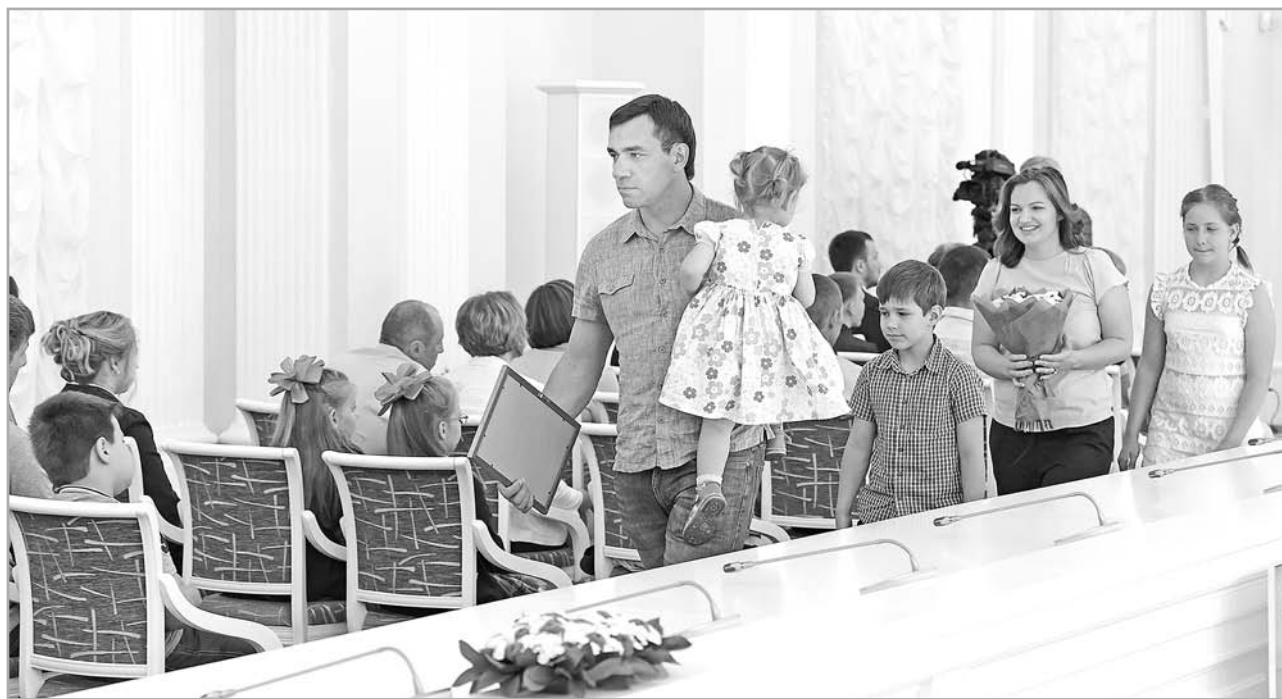
23 молодые семьи получили жилищные сертификаты

Если говорить конкретно, то в ходе совещания обсуждался вопрос введения в регионе льготного налогообложения для субъектов малого и среднего предпринимательства, применяющих упрощенную систему налогообложения. Согласно ему, планируется для высокоприоритетных видов деятельности по объекту налогообложения «Доходы» снизить налоговую ставку с 6% до 1,5%, а по объекту налогообложения «Доходы минус Расходы» с 15% до 5%. Для приоритетных видов деятельности по этим направлениям предполагается применять налоговую ставку 3% и 7,5% вместо 6% и 15% соответственно. Для сравнения, в соседней Ярославской области,