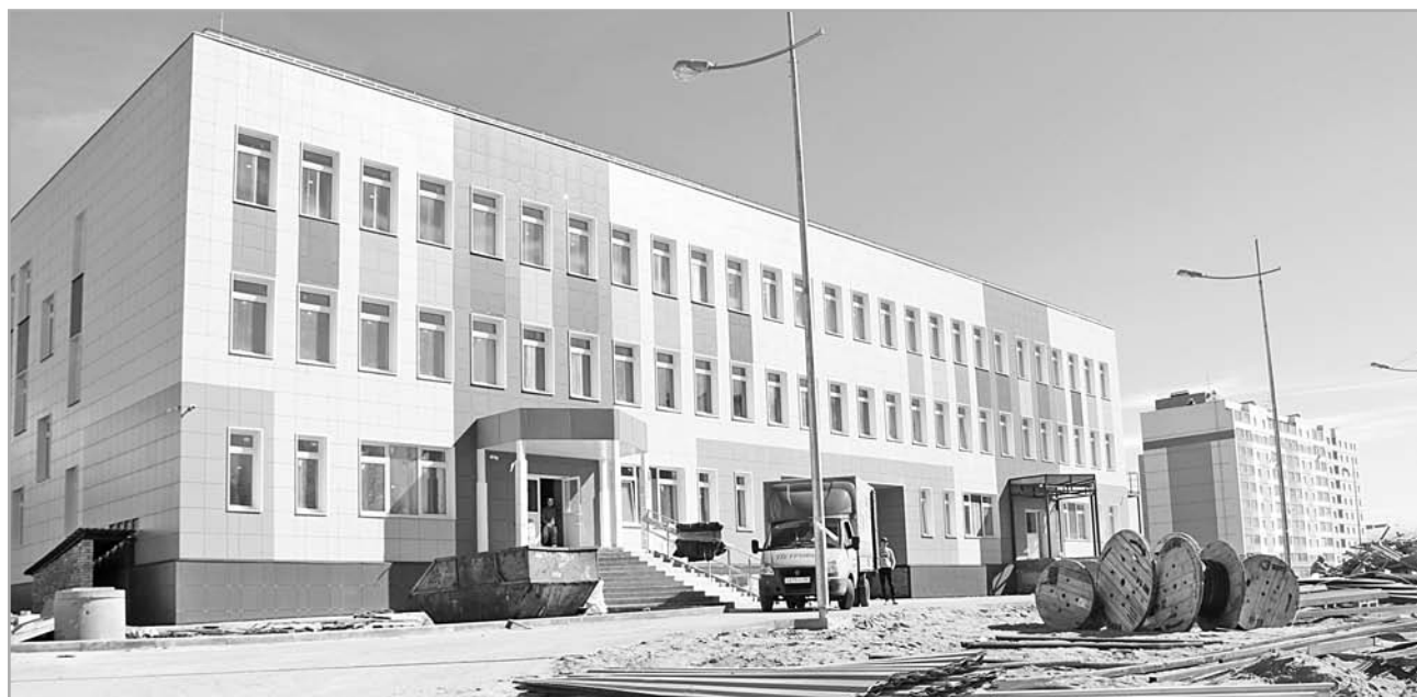
Согласно графику работ школа – детский сад в Юности откроется 1 сентября

В этом году ребят ждут в 23 загородных, 525 лагерях дневного пребывания, 67 лагерях труда и отдыха, 30 палаточных лагерях. Ожидается, что за три смены в Тверской области смогут отдохнуть более 70 тысяч детей, в том числе 3,9 тысячи ребят поправят здоровье в санаториях. А всего в 2019 году организованными формами отдыха будут охвачены порядка 83,7 тысячи ребят.