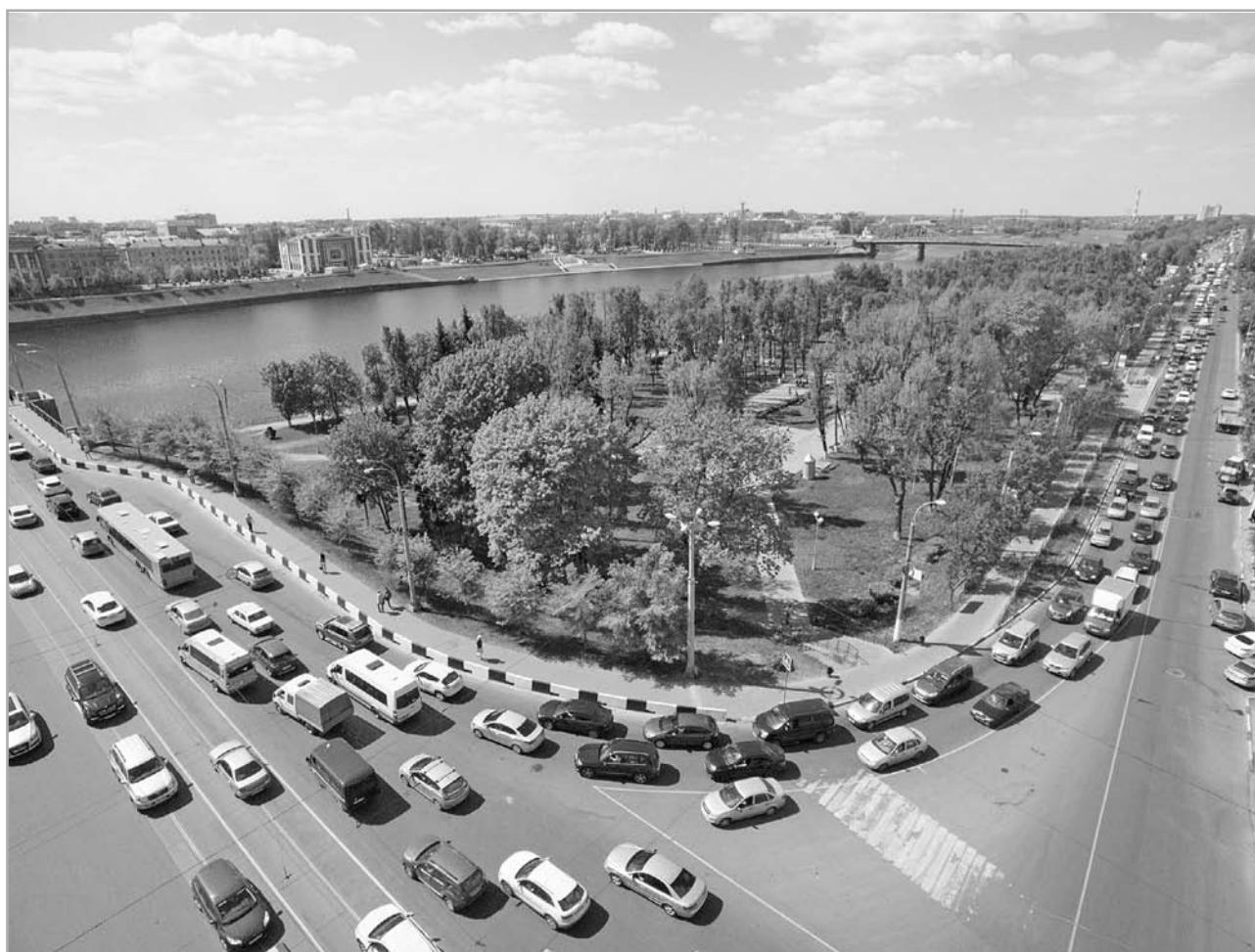
Систему пассажирских перевозок ждет перезагрузка

План действий уже намечен. В самые короткие сроки будет сформирована «дорожная карта», согласно которой еще через месяц с жильцами будет заключено коллективное комплексное соглашение на переселение и начнется второй этап – передача корпорации «ВЭБ.РФ» этих зданий. Хотя о планах пока только было заявлено, но уже известно, что концепция реновации Морозовского городка предусматрива-