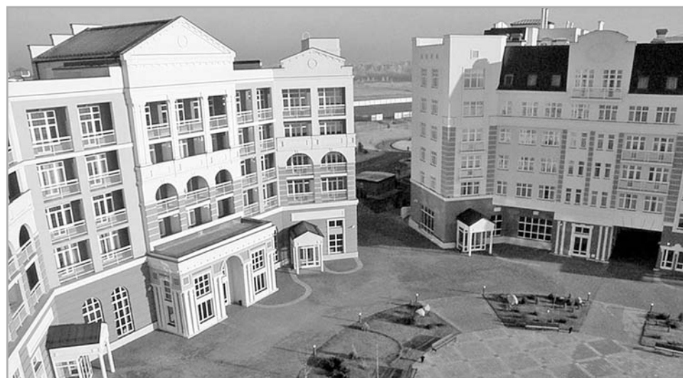
Курортный комплекс «Radisson Resort Zavidovo» – один из проектов ВЭБ.РФ, успешно реализованный в регионе

Свою лепту в развитие региона готов внести и «Газпром». Компания намерена принять финансовое участие в модернизации теплоэнергетического комплекса региона с целью повысить эффективность использования тепловых ресурсов Верхневолжья. Возобновление плодотворного диалога с «Газпромом» стало возможным благодаря тому, что Тверская область сократила долг перед компанией более чем на 4 млрд рублей.