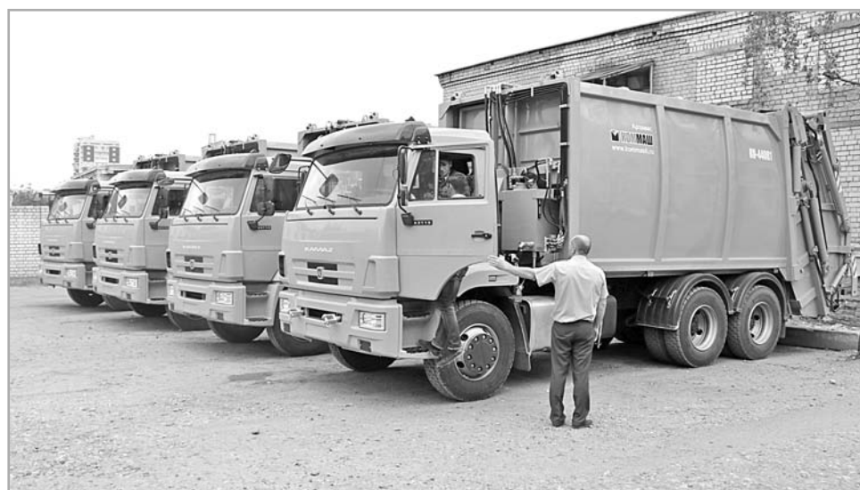
В регион поступила первая партия зеленых мусоровозов на базе «КамАЗа»

вид госпомощи предусмотрен для 142 молодых семей из 30 муниципальных образований области. Объем средств консолидированного бюджета на предоставление сертификатов составляет более 97,3 млн рублей, из которых свыше 35,7 млн рублей – федеральные средства, 40 млн рублей – областные, 21,4 млн рублей – средства муниципальных образований региона. В следующем году в Тверской области планируется оказать поддержку в приобретении и строительстве жилья 200 семьям. Социальные выплаты могут использоваться молодыми семьями для приобретения и строительства жилья, уплаты первоначального взноса при получении кредита, а также для погашения основной суммы долга и уплаты процентов по жилищным креди-