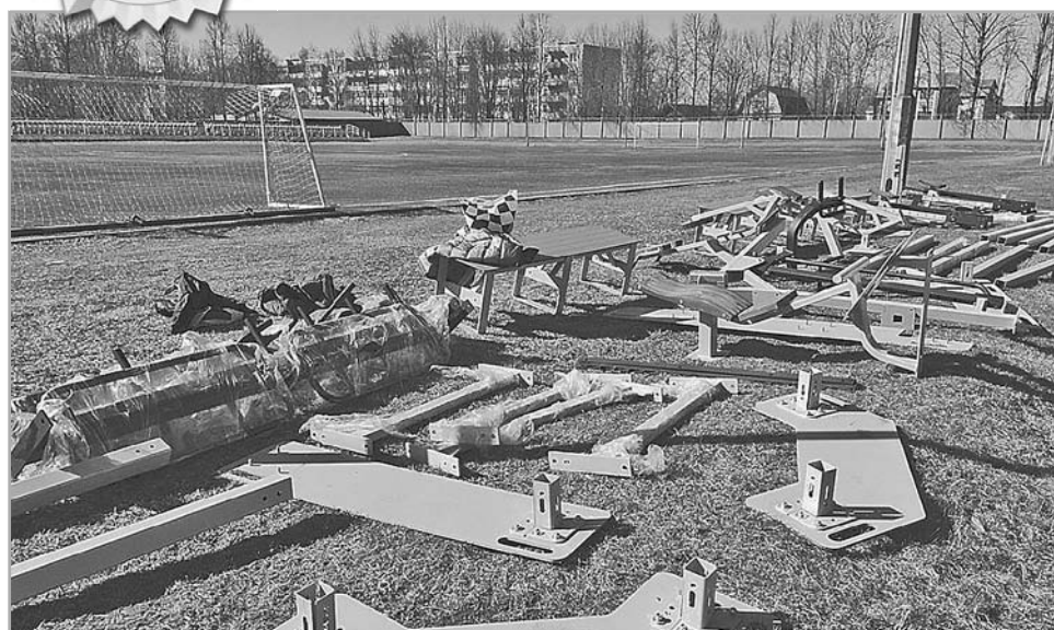
Идет монтаж оборудования на спортивной площадке

Здесь можно будет подготовиться к ГТО и сдать нормативы