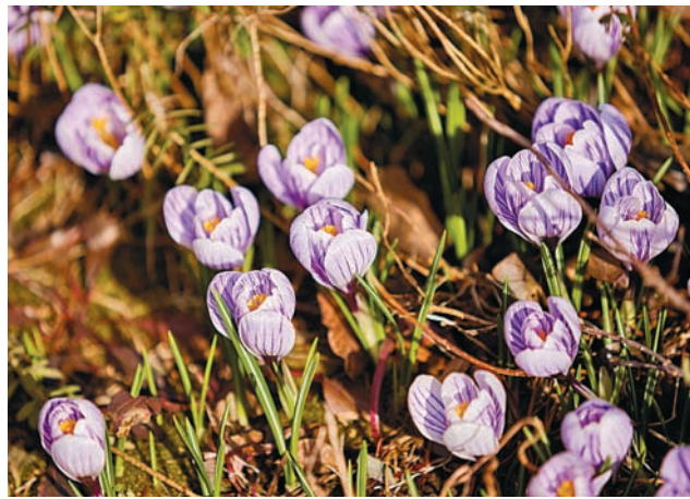
Светлана ФИНЕВИЧ