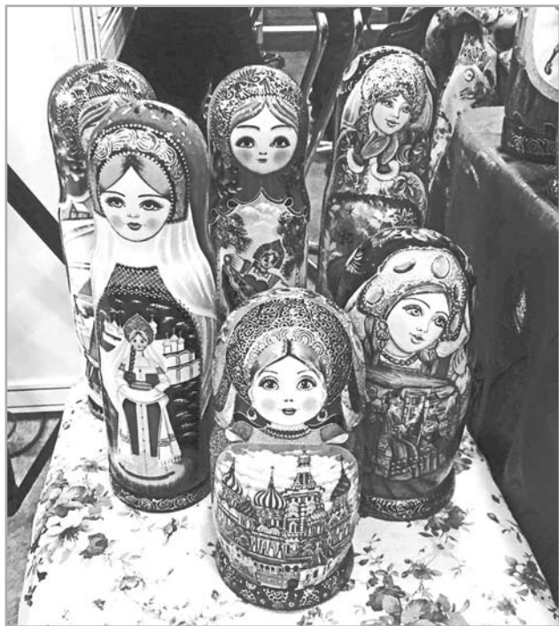
Калязинскую расписную матрешку знают и ценят не только в России, но и за рубежом

В целом по итогам совета было отмечено, что в Калязине немало местных частных инициатив в сфере туризма, которые не дублируют друг друга, а их реализация поспособствует созданию новых объектов турпоказа и привлечению еще большего числа гостей и туристов. Было принято решение одобрить все озвученные проекты для дальнейшего участия в конкурсном отборе на уровне области.