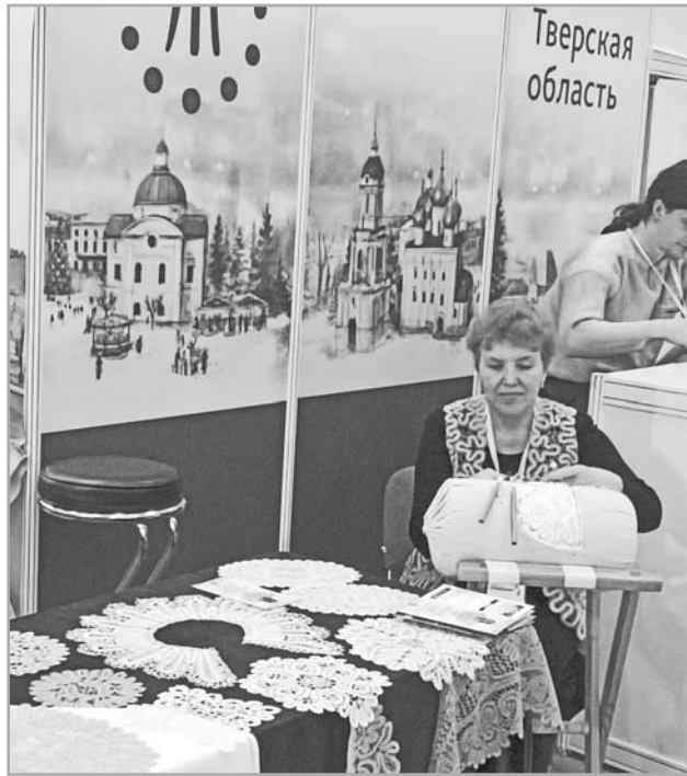
На XV международной туристической выставке «Интурмаркет-2020» калязинцы показали посетителям, как рождаются кружева

Далее обсудили участие калязинских представителей туристической индустрии в областном