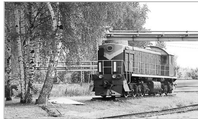
Тверское локомотивное депо, относясь с особым уважением к истории, идет в ногу со временем

Особое внимание в локомотивном депо уделяют трудовому коллективу. Сотрудникам обеспечен полный социальный пакет: предоставляются путевки в детские лагеря, возмещается стоимость билетов на поезд дальнего следования и электрички, выплачиваются материальные средства при нахождении женщины в декретном отпуске и многое другое. Не забывают на предприятии и про молодежь. В целях профессионального роста и личного развития у молодых работников есть возможность принимать участие в различных тренингах, бизнес-играх и инновационных проектах.