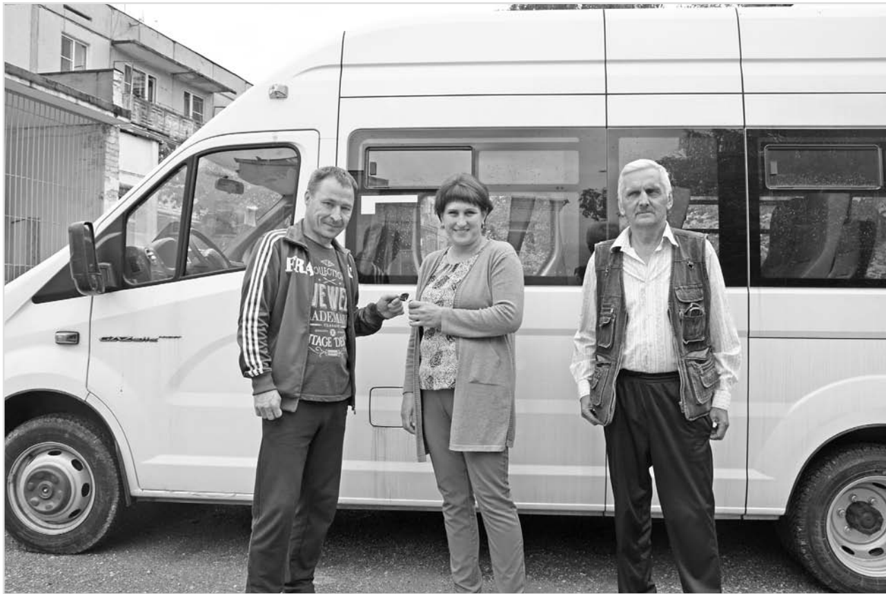
Услуга «социального такси» очень востребована. И вот скоро в рейсы будет выходить новый удобный автомобиль

альный автомобиль» ездит в областную столицу два раза в месяц (во второй и четвертый вторник каждого месяца). Спрос на бесплатные услуги «социального автомобиля» постоянно растет, поэтому новая машина в учреждении действительно необходима.