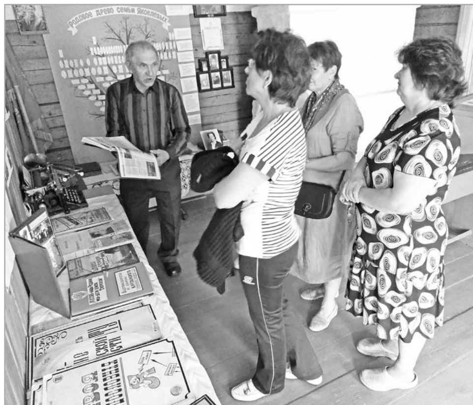
В селе Борзыни Кувшиновского района действует Музей крестьянских родословных, в котором собраны материалы по генеалогии, воспоминания, коллекции старинных книг, фотографии, личные дневники, крестьянская утварь

В западнодвинском музее художественная выставка «По жизни с Любовью!» будет работать до конца июля.