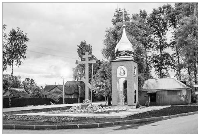
В праздничную дату для жителей Ленино состоялось торжественное открытие и освящение часовни

Торжественное открытие и освящение часовни Святого Георгия Победоносца состоялось утром 6 июля в сквере на улице Гагарина. Часовня – это не просто сооружение, украшающее теперь поселок, это частичка души, вложенная в это место, а зна-