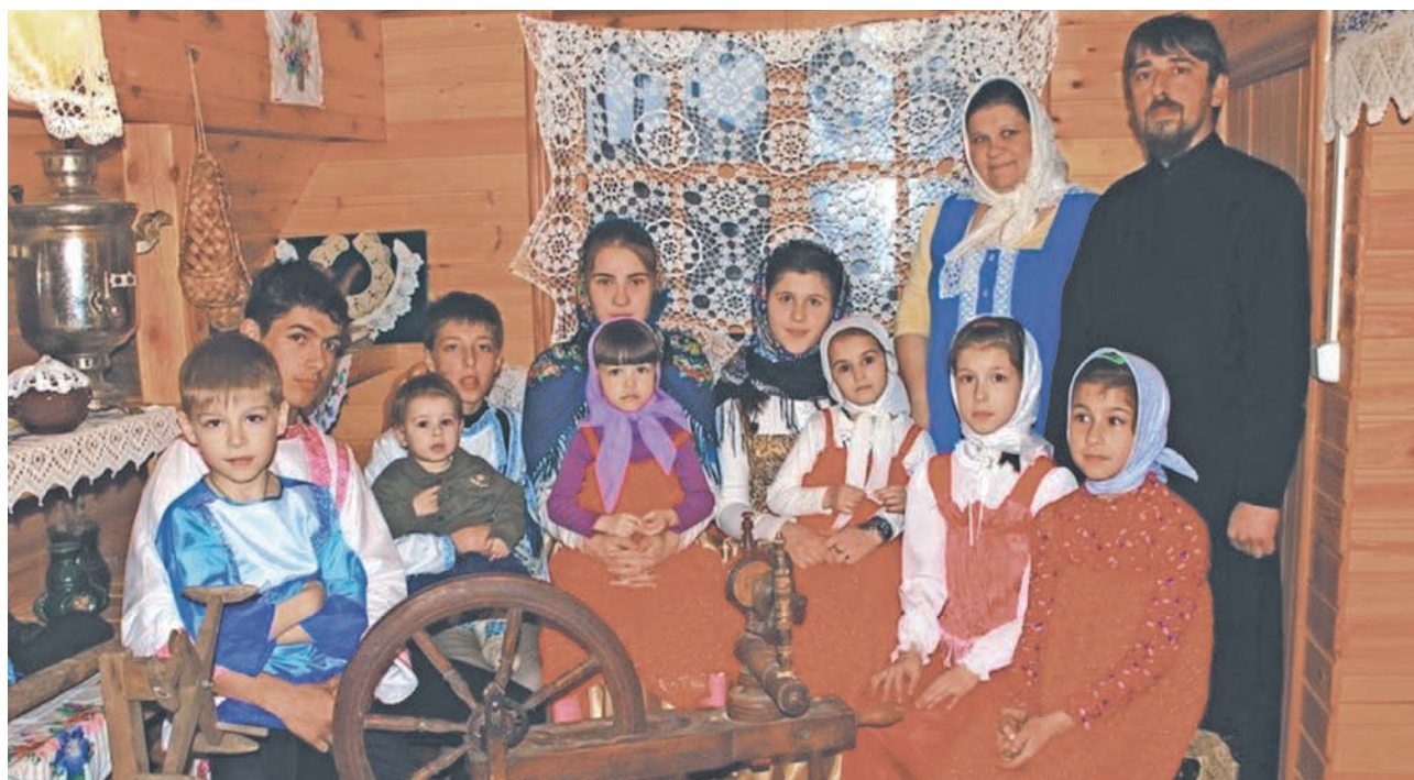
Семья Гаврышких в своем домашнем музее народного быта

Мамино внимание сосредоточено и на быте, и на достижениях детей. Нет, не только на наградах – моменты крещения, первые шаги, первые слова и успехи, смешные выражения, рисунки, фотографии, – все это скрупулезно записывается, собирается и хранится в семейном архиве. И это все те кусочки радости, из которых каждый день в большой и дружной семье создается атмосфера любви и добра.