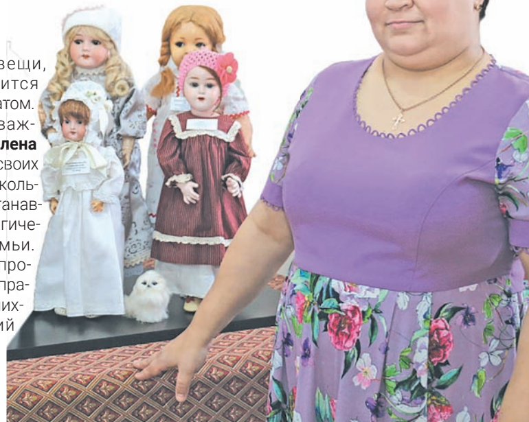
Матушка Елена у экспозиции «Куклы и игрушки нашего детства» в Торопецком краеведческом музее

В доме много цветов, во дворе в розарии зимуют кусты роз – одно из увлечений хозяйки дома. А еще она вышивает и шьет, одной из первых в Торопце увлеклась созданием