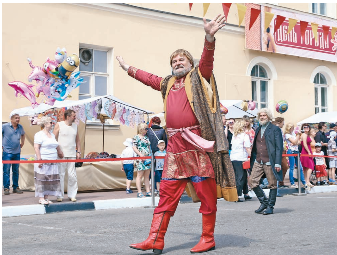
На Театральной площади гостей праздника приветствовал тверской купец Афанасий Никитин

Сразу два больших праздника отметила Тверь 18 июня: День города и Русские Ганзейские дни