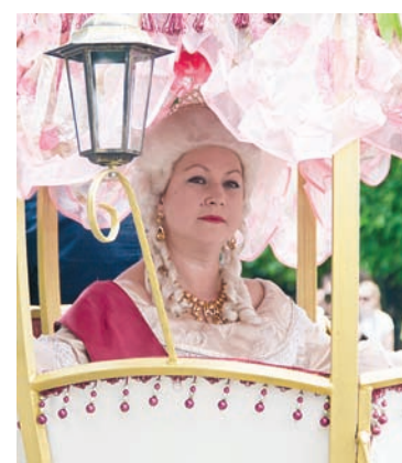
В Твери в День города можно было встретить и ремесленников, и древних воинов, и даже императрицу Екатерину