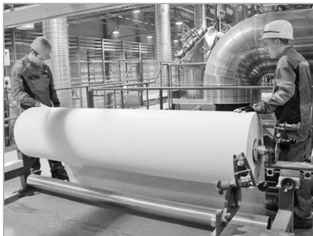
В планах компании – запуск второй линии производства минеральной ваты. Планируемый объем инвестиций – более 3 миллиардов рублей

– Мы будем способствовать развитию компаний, которые платят налоги, ведут прозрачный бизнес, создают рабочие места и комфортные условия для жизни людей, – отметил Игорь Руденя. – Наша задача – обеспечивать условия для реализации ваших дальнейших проектов.