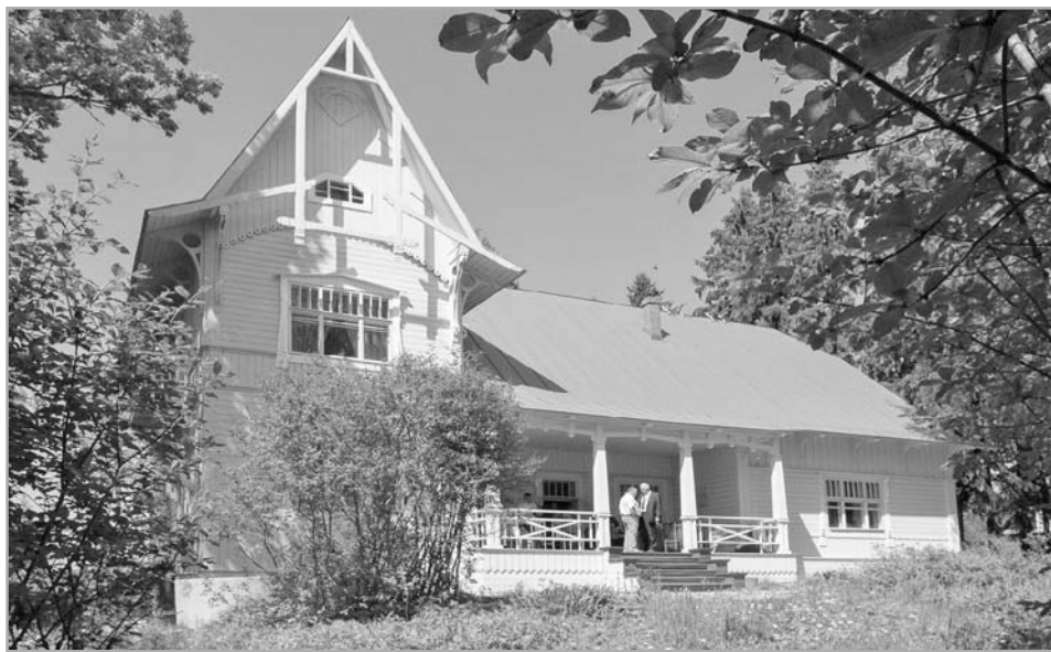
Проект «Экология парка Дачи «Чайка» подразумевает ряд мероприятий, реализация которых решит одновременно и вопросы эстетики, и вопросы безопасного отдыха на берегу знаменитого озера Удомля

Проекты-победители являются важными для развития городов АЭС и позволяют аккумулировать усилия атомных станций, органов власти и общественности для их реализации. Особенностью этого года стало то, что конкурсные проекты прошли процедуру публичных слушаний и были рекомендованы жителями городов. Определяя наиболее значимые проекты, жители поучаствовали в формировании бюджета