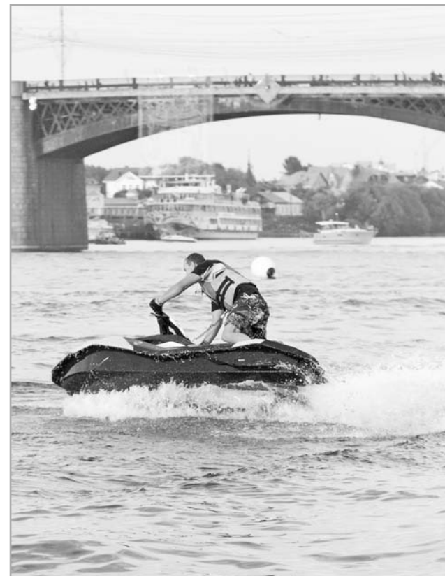
Соревнования по аквабайку стали настоящим украшением Дня города, неким феерическим шоу, которое для жителей Твери пока все-таки в диковинку

Изюминкой неофициальной части стало показательное выступление чемпиона России по аквабайку в дисциплине «фристайл» Арсения Матанцева. Супертрюки летающего аквабайкера пока у нас в стране никто не может повторить. На своем водном мотоцикле он демонстрировал семикратные кульбиты в воздухе, мягко приземляясь на водную гладь, и развороты на 360 градусов. Все выглядело настолько изящно, что походило на некий танец. А волны Волги мягко подыгрывали ему. Будем надеяться, что и тверские спортсмены смогут когда-нибудь достигнуть такого уровня мастерства.