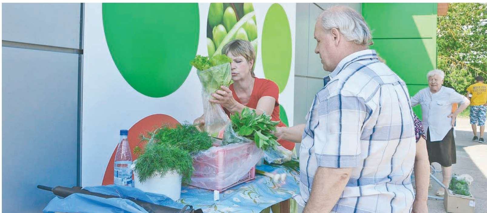
Покупаем тверское. В Твери началось оборудование ярмарок выходного дня, где тверские сельхозпроизводители смогут без оплаты за место реализовывать свою продукцию. Для жителей областной столицы эти торговые площадки станут уникальной возможностью приобрести экологически чистые продукты без наценок. На сегодняшний день работы ведутся на трех объектах. На проспекте Победы в районе дома № 74 они уже на финальной стадии. Аналогичные работы идут ещё на двух территориях – в Артиллерийском переулке в Заволжье и на улице Громова в Мигалово. Торговые площадки будут работать по выходным дням с 8 утра.