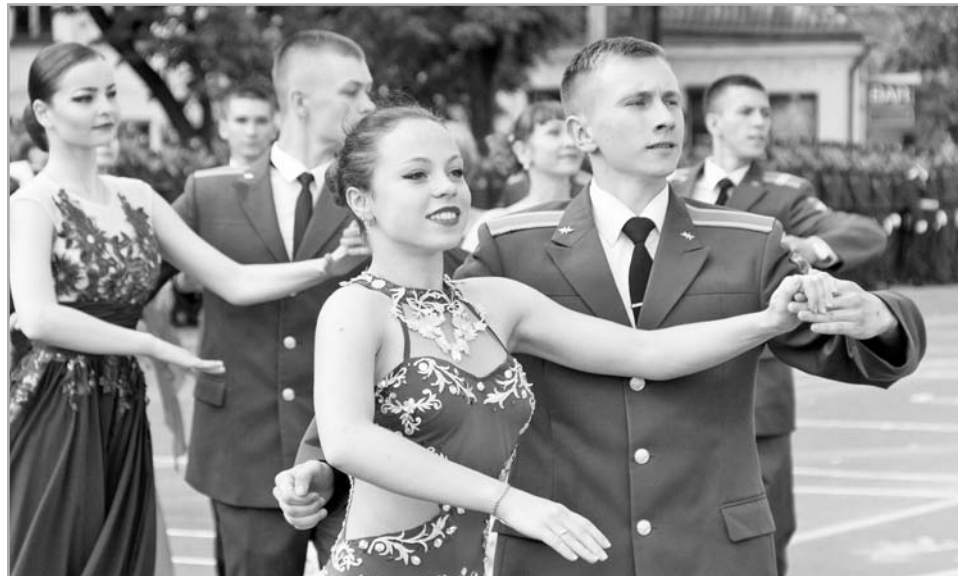
По традиции под завершение торжественной церемонии прощания со знаменем курсанты закуружились в ритме вальса

В Военной академии Воздушно-космической обороны имени Жукова состоялся новый выпуск