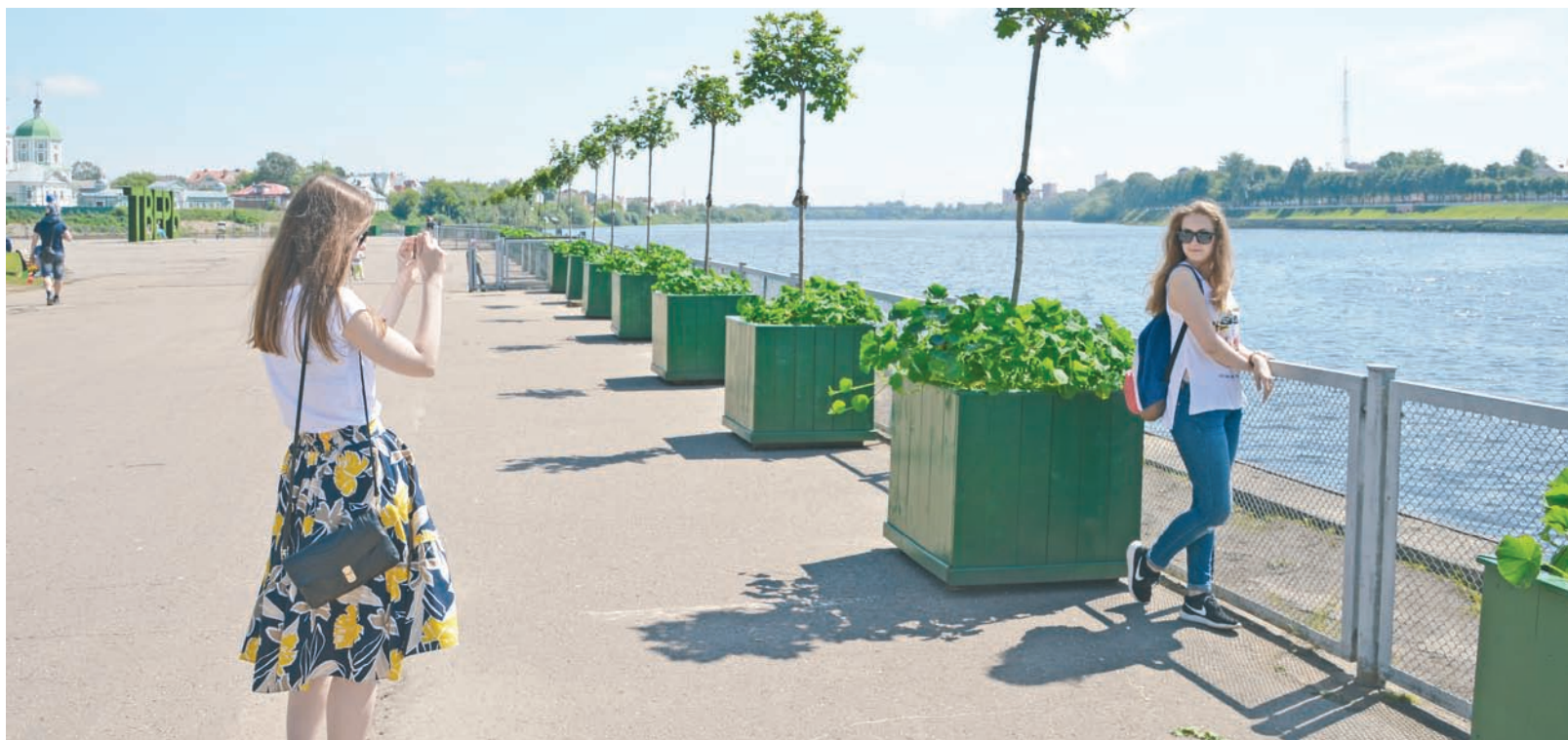
Там, где клен шумит. Ко Дню города в Твери закончены работы по благоустройству сразу на нескольких объектах. На речном вокзале уже встречают пассажиров теплоходов кадки с кленами. Пока что установлено 48 кадок, в ближайшее время их количество увеличится до 70. А на Трехсвятской появилась новая скамейка-змейка длиной шесть метров.