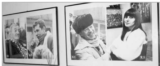
Их знают в лицо миллионы

Так что авторы – весьма интересные личности. Уверяю, представленные на выставке фотографии им под стать. Приходите посмотреть, не пожалеете.