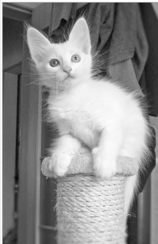
Наши котятки породы турецкая ангора

Фото на конкурс присылайте на электронную почту vedmosti@vedtver.ru или по адресу: 170100, Тверь, ул. Вагжанова, д. 7, редакция газеты «Тверские ведомости».