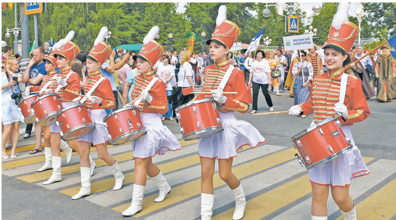
В полдень от обелиска Победы к Театральной площади под бой барабанов тронулось Ганзейское шествие