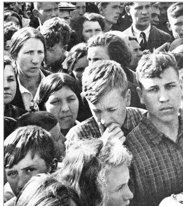
22 июня 1941 года. По радио звучит официальное сообщение о нападении фашистской Германии на Советский Союз и о начале отечественной войны

Люблю крещенские морозы и снега, Люблю февральские метели и ветра, Но зиму в год, когда была война, Я не смогу забыть, наверно, никогда. Мы шли тогда вперед, преследуя врага. Зима в тот год суровая стояла, Мороз ударил загодя до Рождества, И стужа лютая не отступала. С утра, бывало, разгуляется метель И кружит по дорогам, завывая. Колочий ветер бьет в лицо, и рвет шинель, И валит с ног, сугробы наметая. И только вечером, пока закат горит, Утихнет эта буря снеговая, Луны сиянье небо озарит И выведет Медведица Большая. Но до Победы долго, впереди бои За каждый метр своей родной земли. За независимость, за жизнь и честь свою Громили мы тогда фашистскую орду. Теперь, когда уходит в прошлое война, А победители уж стариками стали, На смену им пришли их сыновья, Солдаты, офицеры, генералы. Пройдут полки и батальоны у Кремля Защитников страны нашей огромной, Чтобы российская священная земля Была великой и всегда свободной. А в День Победы победители с утра На грудь приладят боевые ордена И небольшой колонной, глубоко скорбя, Пройдут чеканным шагом у Вечного огня. Потом пойдут на ближний полустанок, На опустевший старенький перрон, Откуда увозил их спозаранок Простой солдатский фронтовой вагон. Но с каждым годом все короче ряд Участников кровавых тех сражений. Немеркнущая память будет жить в сердцах Живущих и грядущих поколений. А над полями, где прошла война, Эхом пронесутся иногда слова: «Поспевай, пехота, не жалей огня». А в ответ ни слова... Тишина.