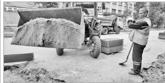
Власть будет контролировать дорожные работы, качество ремонта и соблюдение сроков выполнения работ

Игорь Руденя обозначил: гарантийный период должен быть увеличен до 5 лет. При этом нужно контролировать все шаги, направленные на приведение в порядок дорожной сети региона. Это в первую очередь качество ремонта и соблюдение сроков выполнения работ, подчеркнул глава области.