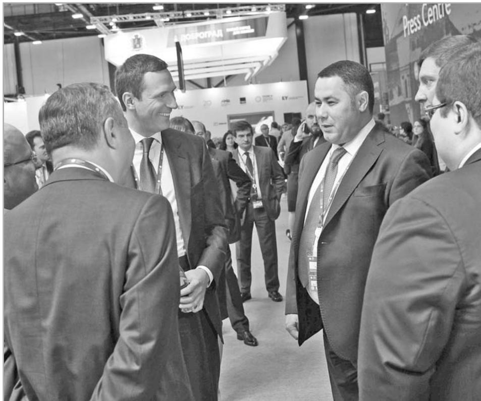
На таких крупных площадках, как Питерский форум, на первый план выходит личность главы региона. И его личные отношения с «сильными мира сего» – ведущими российскими бизнесменами и управленцами

Цитата отнюдь не случайна, ибо говорит о том, что воочию наблюдают жители Верхневолжья в течение последних месяцев: о роли личности в организации, в управлении, в