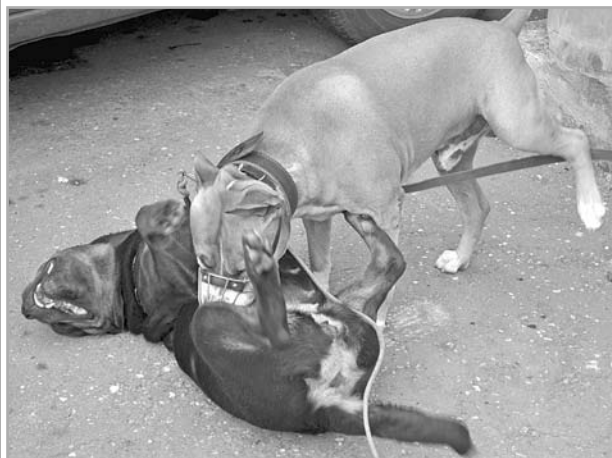
Защекотал Тайсон. Умираю!

Присылайте фотографии своих питомцев на конкурс «Наш любимец-3», который продлится до 1 августа.