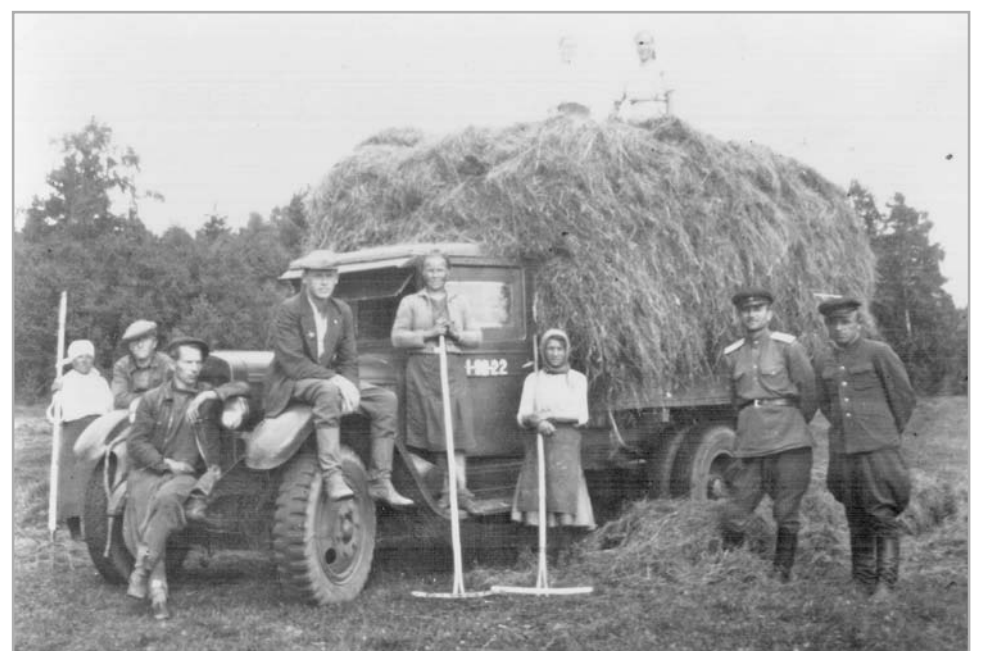
На сенокосе. Спичёво, 1948 год