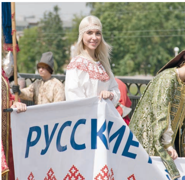
Самые зрелищные мероприятия праздника развернулись в центре Твери

Сразу два больших праздника отметила Тверь 18 июня: День города и Русские Ганзейские дни