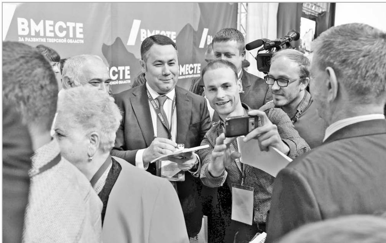
Селфи с главой региона? Почему бы и нет? Обстановка в кулуарах форума к этому располагала

– Избрали тех, кто руководствуется интересами общества, а не корпорации, – отметил глава думской фракции «Единая Россия». – У нас замечательные, инициативные люди, которые помогают другим. Такие же должны быть и во власти.