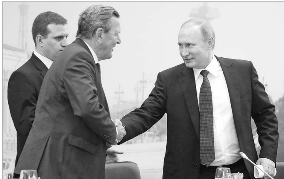
Владимир Путин на Питерском форуме заявил, что Россия смогла решить наиболее острые проблемы в экономике, есть предпосылки для возобновления роста

– Газпром подтверждает свое участие в программе синхронизации и дальнейшей газификации региона. Мы определились, что в ближайшее время детально обсудим объемы инвестиций компании