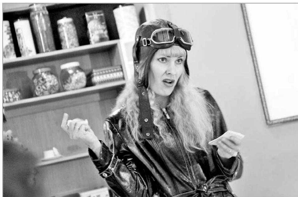
В спектакле-провокации «Я рею знаменем...» звучали стихи и песни Натальи Медведевой

Для того чтобы актеру выступать, ему, наверное, нужно не так уж и много. Но, как минимум, свободное пространство. Московский театр-студия «Верб» представил в Твери на свободном артпространстве «Лес» два спектакля, две свои цветущие ветки: интуитивно-поэтический моноспектакль Максимилиана Потёмкина «Бабочка должна быть белой» и спектакль-провокацию «Я рею знаменем...», основанный на текстах писательницы и певицы Натальи Медведевой.