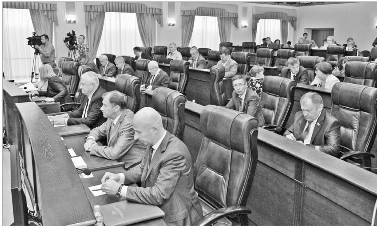
Областной парламент принял на заседании 16 июня постановления о назначении выборов губернатора Тверской области и депутатов регионального Законодательного собрания шестого созыва