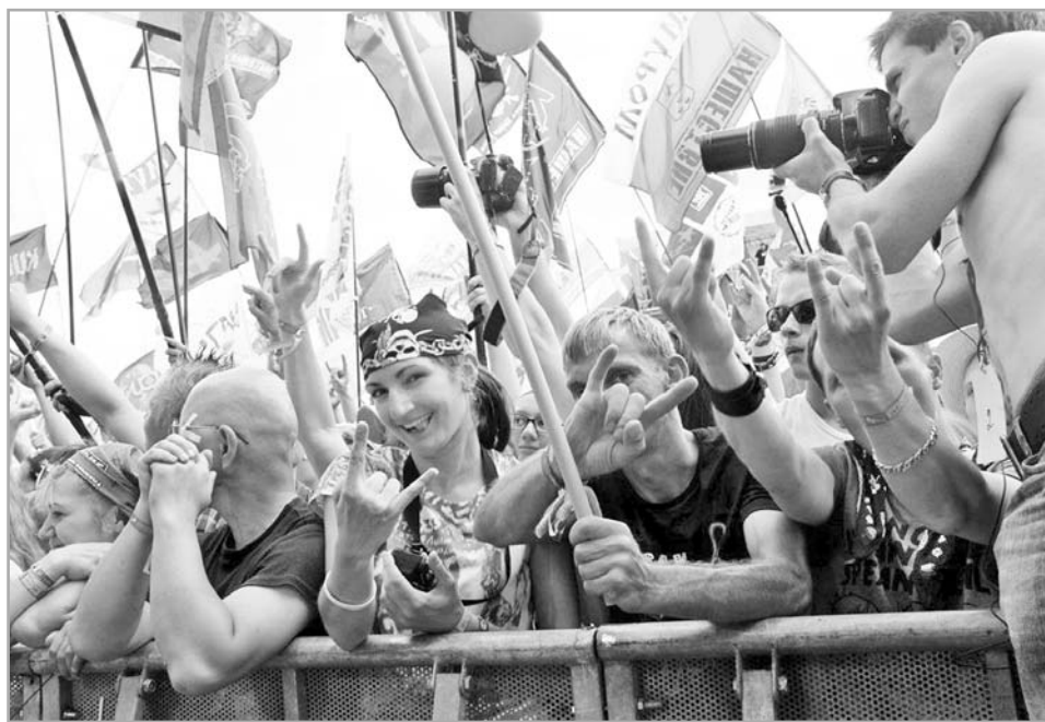
Более 80 коллективов готовят выступление для главного летнего музыкального фестиваля

До 170 тысяч зрителей соберет всероссийский музыкальный фестиваль «Нашествие» в Тверской области.