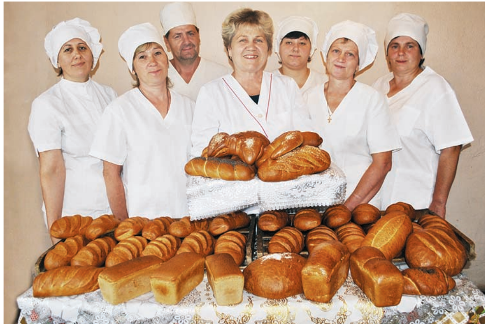
Продукция ООО «Исток» пользуется повышенным спросом: за год произведено более 242 тонн хлебобулочных изделий

Основное направление в растениеводстве – картофелеводство. 2019 год был в целом благоприятным для селян. Валовой сбор картофеля составил 19160 тонн, на 2953 тонны больше, чем в 2018-м, урожайность – 219,7 ц/га (2018 год – 196,2 ц/га). В целом посевная площадь в районе под зерновыми, картофелем, многолетними и однолетними травами составила 9690 га (в 2018-м – 9615 га).