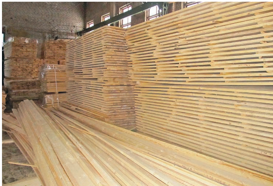
На ООО «Сандовская МТС» в 2019 году был открыт новый цех по переработке древесины

Основное направление в растениеводстве – картофелеводство. 2019 год был в целом благоприятным для селян. Валовой сбор картофеля составил 19160 тонн, на 2953 тонны больше, чем в 2018-м, урожайность – 219,7 ц/га (2018 год – 196,2 ц/га). В целом посевная площадь в районе под зерновыми, картофелем, многолетними и однолетними травами составила 9690 га (в 2018-м – 9615 га).