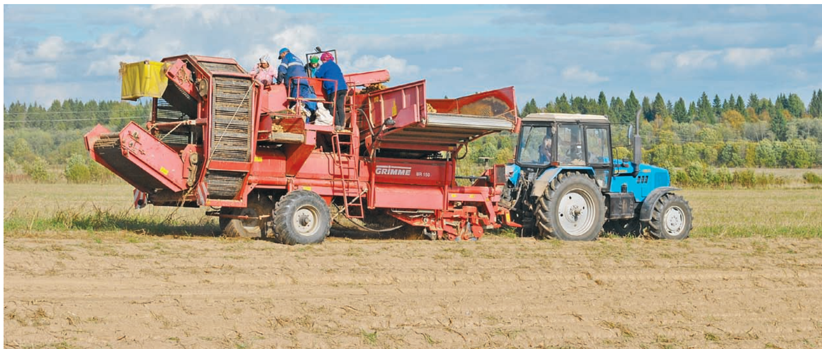
В районе активно ведется работа по возвращению земель в сельхозоборот