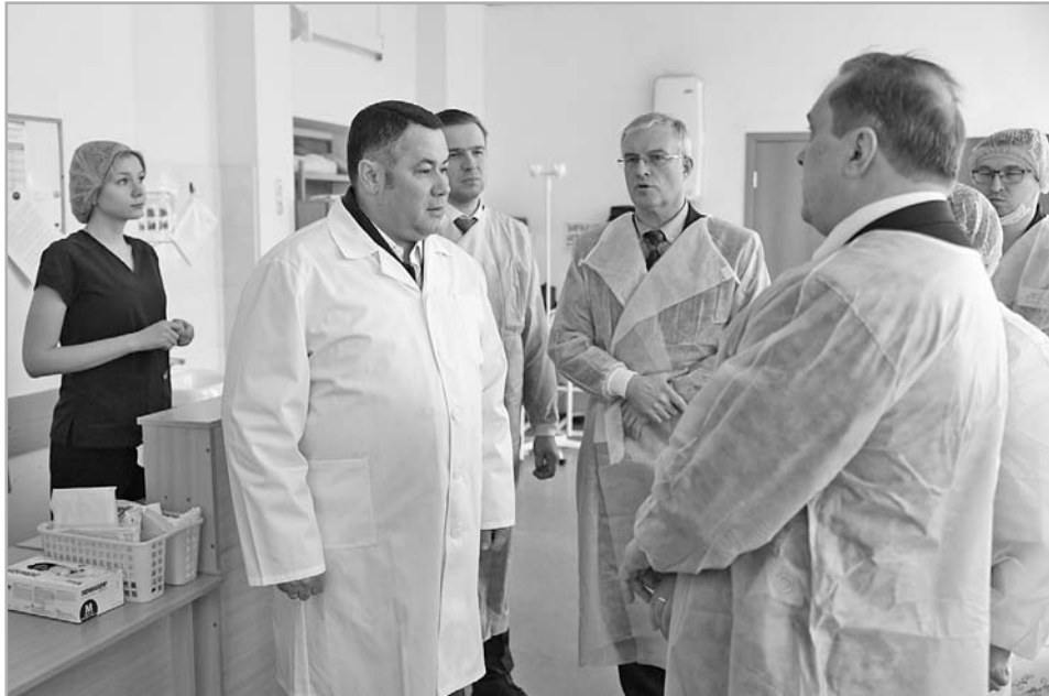
Губернатор Игорь Руденя поручил принять дополнительные меры по предупреждению распространения коронавируса на территории Тверской области

Впрочем, каждый и сам может видеть, какие беспрецедентные меры принимаются для борьбы с заразой. В Тверской области, как и во всей России, введен режим самоизоляции, и все сознательные граждане его соблюдают. Опустели улицы областного центра, отменены все массовые мероприятия, перенесены сроки сдачи выпускных экзаменов. Ситуацию усугубляет то обстоятельство, что главный очаг коронавируса, Москва, находится все-таки в часе езды на скоростной электричке от Твери. Тем не менее строгие санитарные меры, которые вводятся в области (и постоянно ужесточаются, а к тому же жестко контролируются), дают положительные результаты. В