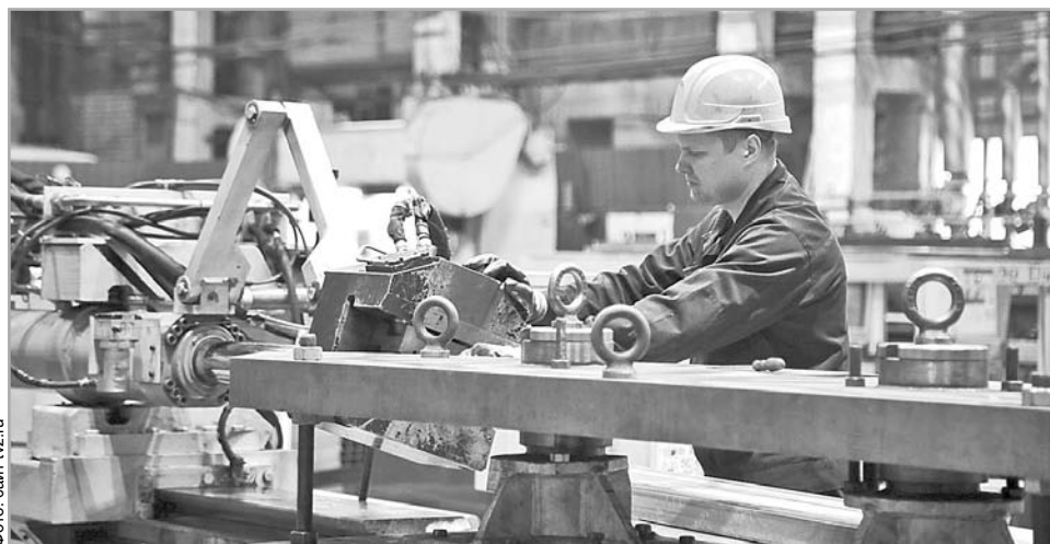
Предприятия машиностроения Тверской области вошли в реестр системообразующих

В Тверской области создан реестр системообразующих предприятий регионального и муниципального значения, которым поддержка будет оказываться в первую очередь. В него вошли более 220 предприятий региона, на которых в совокупности трудятся более 60 тысяч человек – каждый десятый, занятый в экономике. Это предприятия из сферы машиностроительной, лесной, медицинской, пищевой, полиграфической, химической и легкой промышленности, сельского хозяйства, туристической отрасли и других отраслей. Они обеспечивают 37% налоговых поступлений в бюджет региона. Как отметил зампред