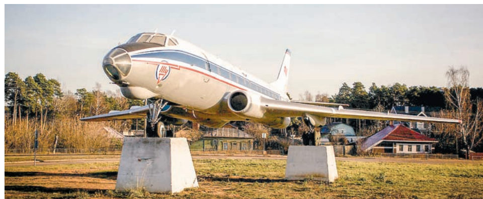
Волонтеры очистили самолет-памятник «Ту-124» от коррозии и установили подсветку

– Домику-пряничку сейчас очень грустно, его крыша течет и портит внешний вид, который мы так старались сделать, – пишут они в своей группе во ВКонтакте. – Если вы специалист по установке фальцевых кровель или знаете таких мастеров, пожалуйста, напишите нам.