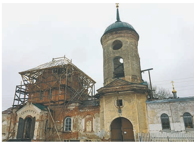
Современный вид Николо-Столпенского мужского монастыря