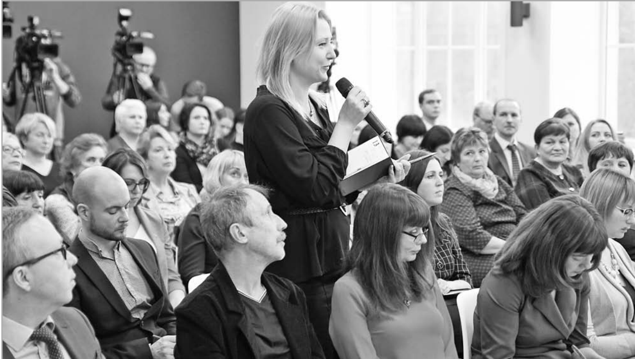
Пресс-конференция губернатора стала одним из главных событий года