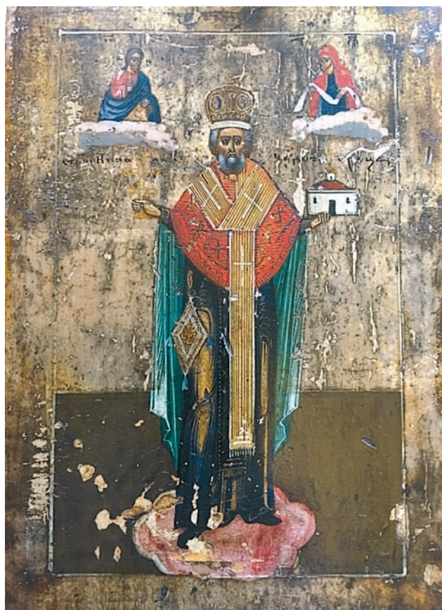
Столпенский образ Святителя Николая

И в заключение «вишенка на торте»: монахиня Досифея, которой этот образ был подарен почти 150 лет назад, в дальнейшем стала первой игуменьей Вышневолоцкого Казанского монастыря – одной из самых многочисленных женских обителей России на рубеже XIX – XX веков.