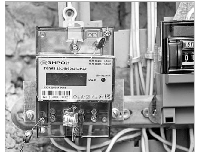
Установлен однотарифный счетчик «Топаз» с электронным табло – надежный продукт отечественного производства от завода-изготовителя «Энрон Энерго»