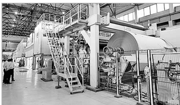
Бумагоделательная машина № 7

Берут на Каменской БКФ и качеством, и ценой, и скоростью выполнения заказов. Сохранять в условиях постоянно меняющейся экономической ситуации высокую конкурентоспособность помогает качественный менеджмент предприятия,