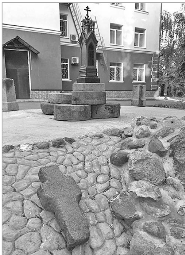
Каменный крест был обнаружен в ходе научной экспедиции