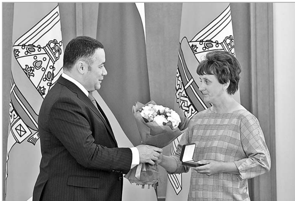
Накануне Дня России около 30 жителей Верхневолжья получили из рук губернатора государственные и региональные награды

Концепцией предусмотрена работа с инвесторами по принципу «одного окна», предполагающая комплексное сопровождение инвестпроектов. Среди ключевых мер – совершенствование законодательства, регулирующего условия ведения инвестиционной деятельности, создание системы эффективных налоговых преференций, утверждение комплекса градостроительной документации, ориентированной на социально-экономическое развитие территорий. Еще одна важная задача – развитие инфраструктуры, помощь при подключении к энергосетям, имущественная поддержка резидентов через предоставление участков на льготных основаниях, вовлечение в оборот неиспользуемого имущества и другие.