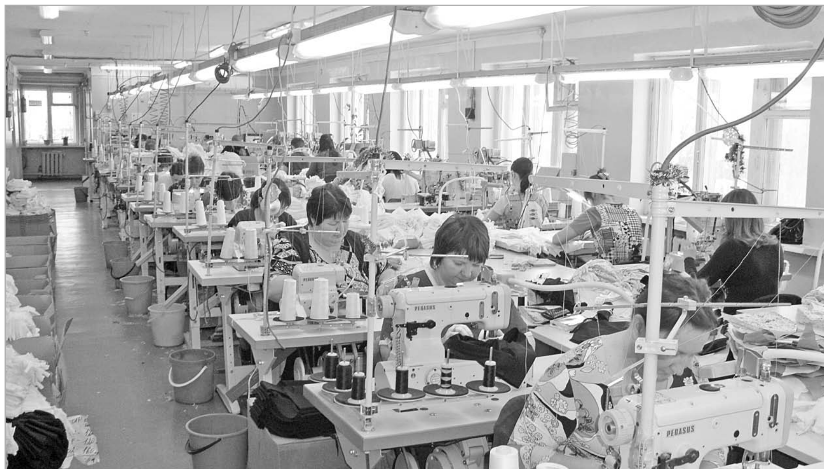
В регионе сегодня действуют свыше 300 предприятий легкой промышленности, где работают почти 10 тысяч человек

Именно потому и возрождается сейчас система профориентации, среднего профессионального обучения, именно поэтому сегодня в особой цене не просто высококвалифицированные, а высококлассные специалисты, в первую очередь рабочих специальностей. Иллюстрирует это, в частности, и список отмеченных государственными и региональными наградами в преддверии Дня России. Среди них – медицинские сестры, фрезеровщики, учителя, лесничий, соцработник, доярка. Это продолжает и общефедеральную тенденцию: в списке Героев Труда Российской Федерации, насчитываемом чуть более сорока человек (напомним: это звание было учреждено всего шесть лет назад), около половины – именно простые труженики, рабочие.