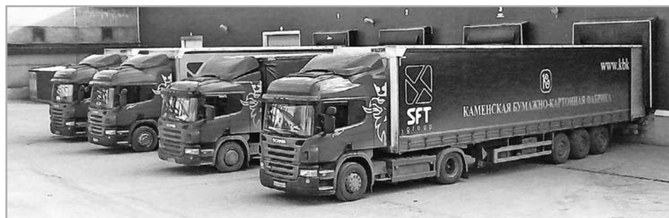
Отгрузка готовой продукции

Словом, у предприятия есть все, чтобы продолжать развиваться. Можно не сомневаться, что в историю предприятия будут вписаны новые успехи и достижения.