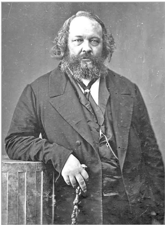
Портрет Михаила Бакунина, 1860 год

поступил в Петербургское артиллерийское училище, а через 5 лет был из него отчислен за дерзкий ответ начальнику училища.