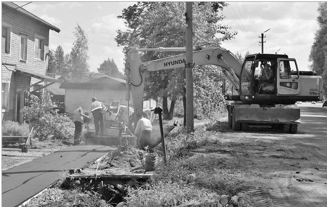
В 2019 году Оленинский район благоустроил несколько объектов по программе «Городская среда»

– В 2019 году отремонтированы улицы Крестыанская и Октябрьская, участки улиц Горбачева, Горького, Пушкина, Больничная, 1 Мая, 7 дворов по ул. Пионерская и Строителей – таким образом, весь этот микрорайон, самый большой в поселке, за два года полностью приведен в порядок. «Дороги поселка Оленино» – самый успеш-