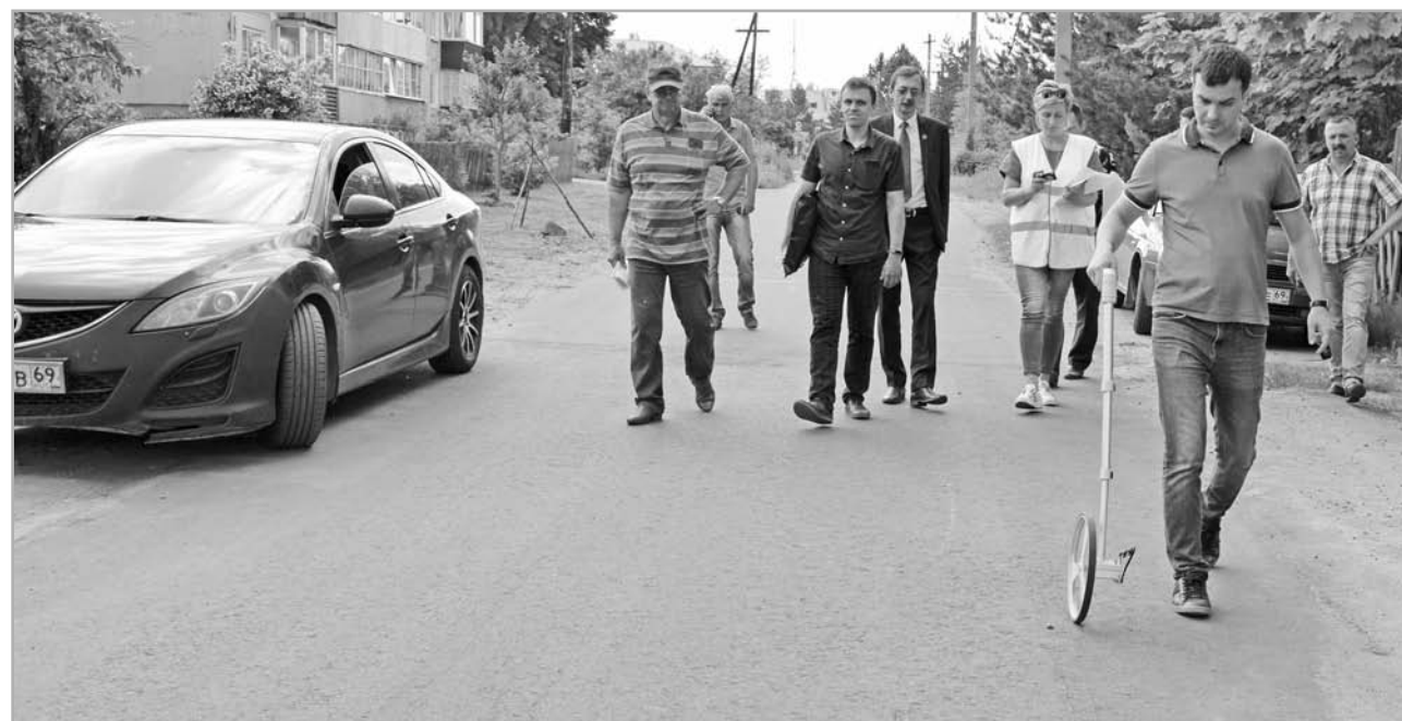
В основном плановый ремонт дорог завершен. Однако в нескольких местах комиссия выявила недочеты, которые подрядчик должен устранить

Основной объем работ по дорожной сети Оленино в этом году завершается и планируется направить все средства дорожной программы 2020 года на поддержку поселка Мирный. Что вполне справедливо. В Мирном, в отличие от Оленино, серьезный ремонт дорог не проводился давно. Завершена подготовка проектной документации по двум основным улицам п. Мирный, уже начато проектирование ремонта 10 дворов поселка. Вот из этих объектов и будет состоять заявка Оленинского района на 2020 год. За год будет приведен в порядок Мирный,