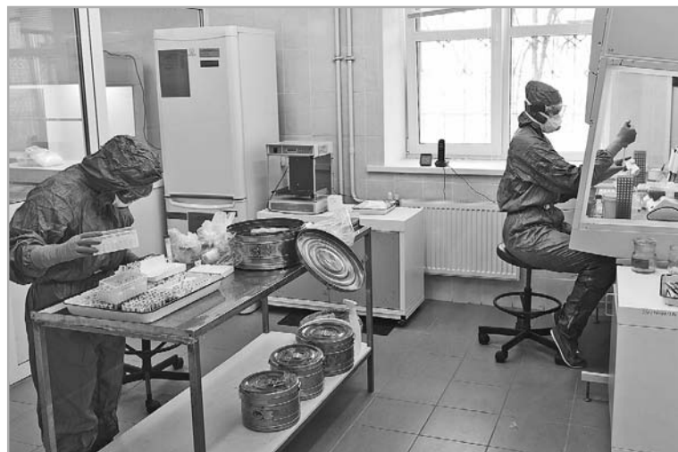
В регионе ежедневно делают тесты на коронавирус, только в понедельник были обследованы 1400 человек