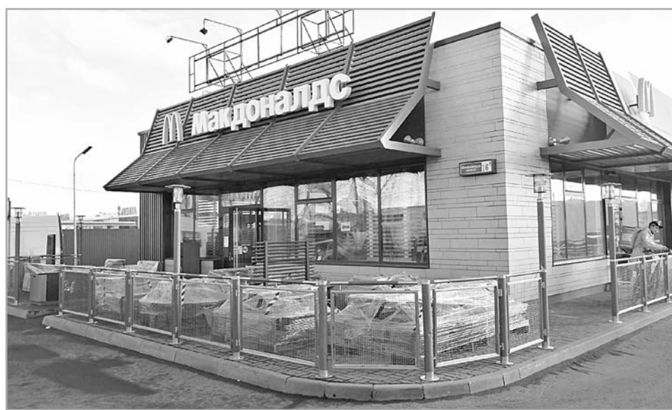
Заведения общественного питания в связи с карантинными мерами закрыты для посещения и несут убытки, как и предприятия многих других отраслей экономики

– Наша ключевая задача, которую поставил губернатор Игорь Руденя перед Правительством Тверской области, – сохранить максимально возможное число наших компаний и рабочие места, поддержать предпринимателей. Акцент сейчас – на помощь тем отраслям, которые оказались действи-