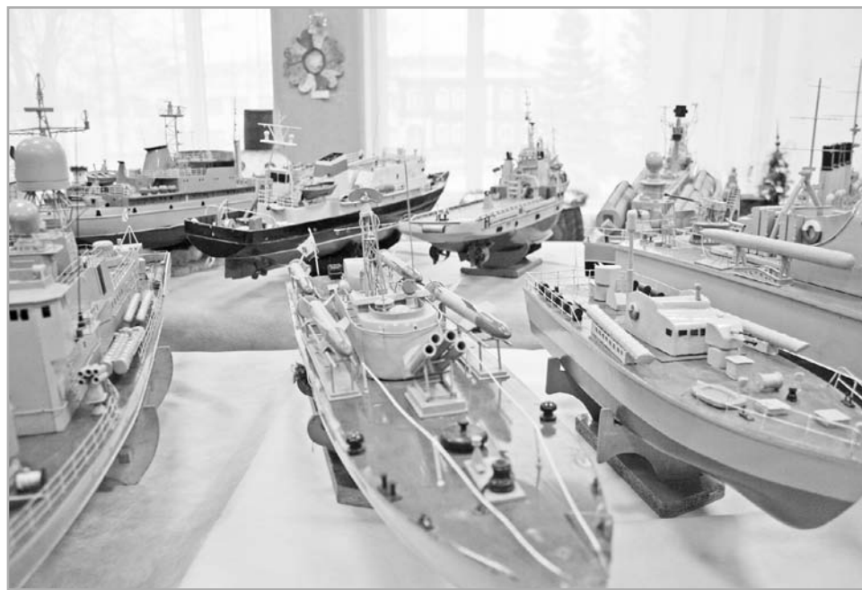
Работы юных торопчан побеждают на областных конкурсах