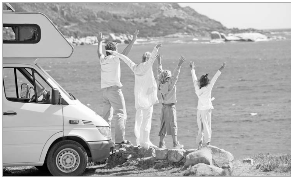
Многие туристы сегодня путешествуют самостоятельно

В тверских турагентствах отмечают, что наши жители чаще всего выбирают бюджетные туры эконом-класса и чуть выше эконома. Например, даже в Сочи не летят на самолете, как это делают москвичи, а едут автобусом. По оценкам федеральных экспертов, самыми бюджетными курортами являются Анапа, Геленджик, Витязево. Здесь много частных домов и мало «звездных» отелей.