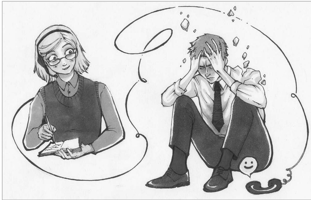
Рис.: Светлана РУДАКОВА

Одно из основополагающих направлений психологии. Автор Зигмунд Фрейд. Основная идея учения – в поиске причин личностных расстройств