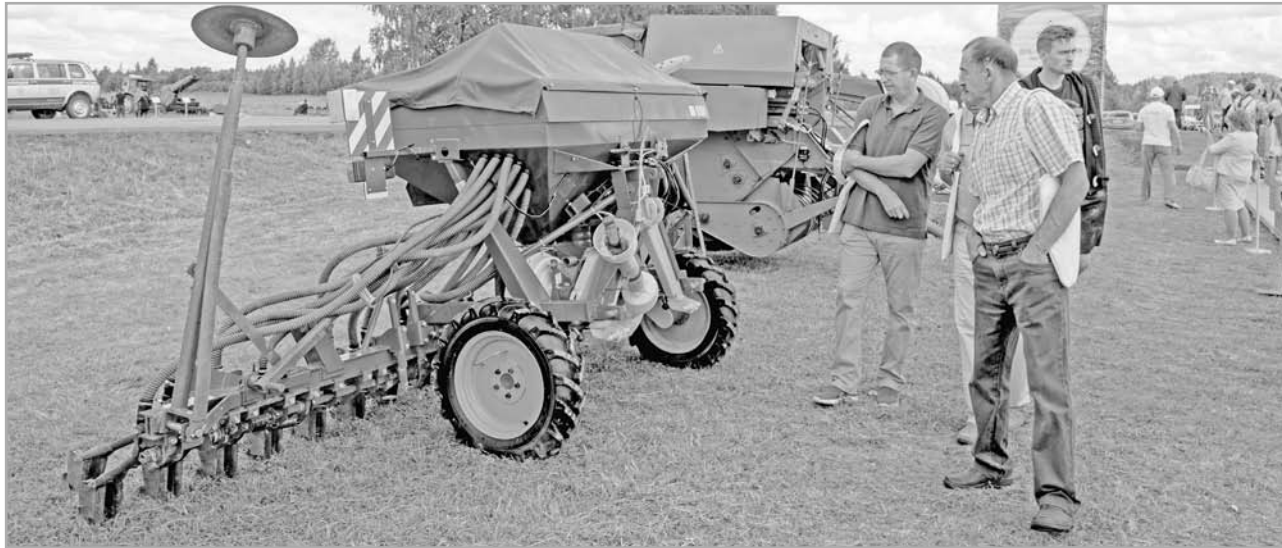
Новейшая техника увеличивает производительность труда аграриев

В агротехнопарке планируется также строительство современного льнозавода, учебно-производственного комбината для подготовки кадров, селекционно-семеноводческого центра, складских помещений и др.