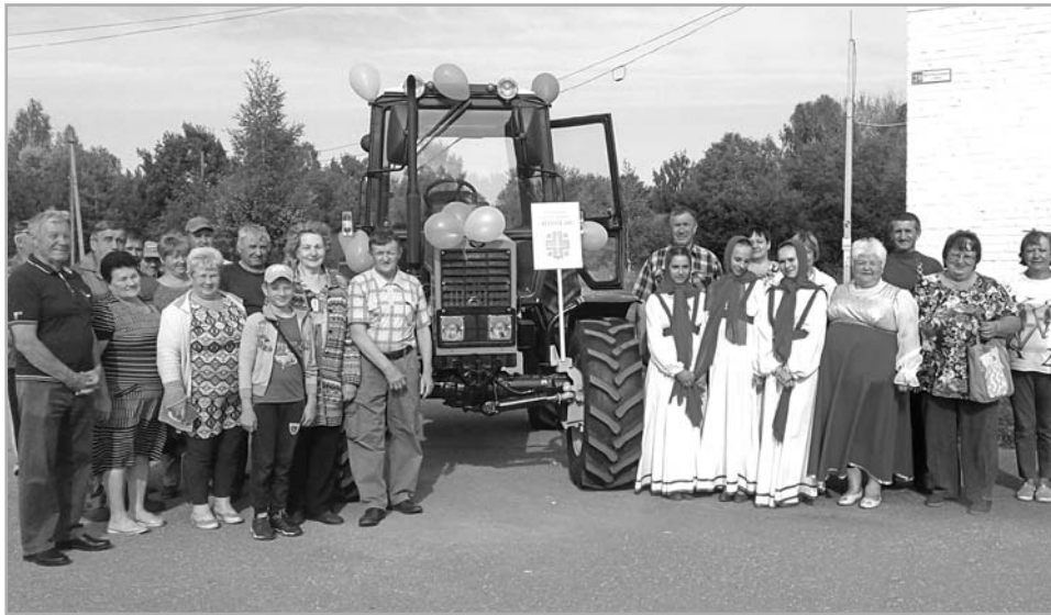
Сельское поселение «Итомля». Поставка колесного трактора «Беларус 82.1»