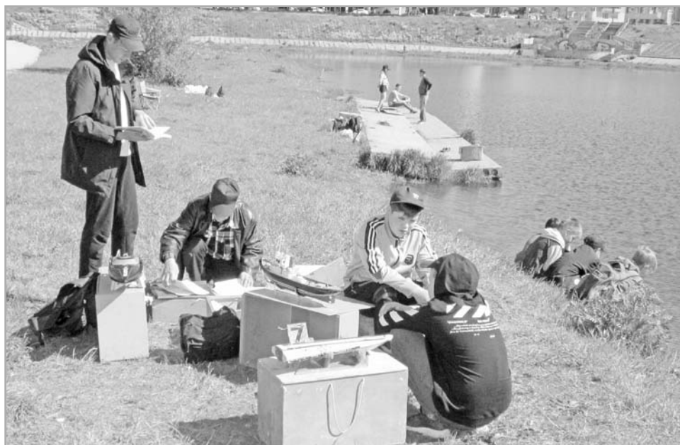
Маленькие модели испытывают на большой воде

Но он работает не за награды. Горящие гла-