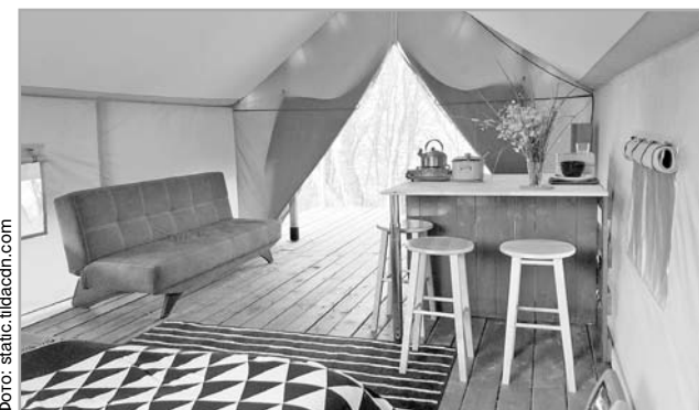
На Селигерских озерах в этом году раскинулись палатки «все включено»