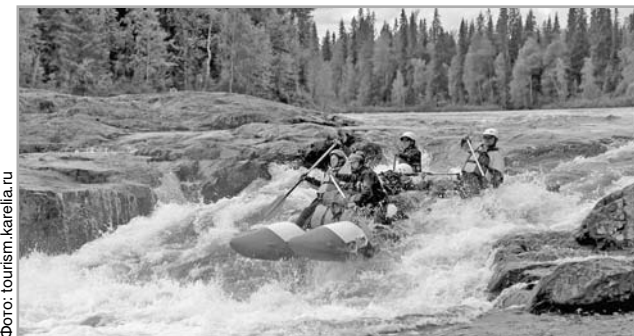
Туры в Карелию ориентированы на активный отдых

Те же тенденции характерны и для России в целом, сделали вывод эксперты сайта Price.ru. Данные опубликованы в федеральных СМИ. Спрос на групповые туры, в частности на российский юг, снизился на 51%. То есть сей-