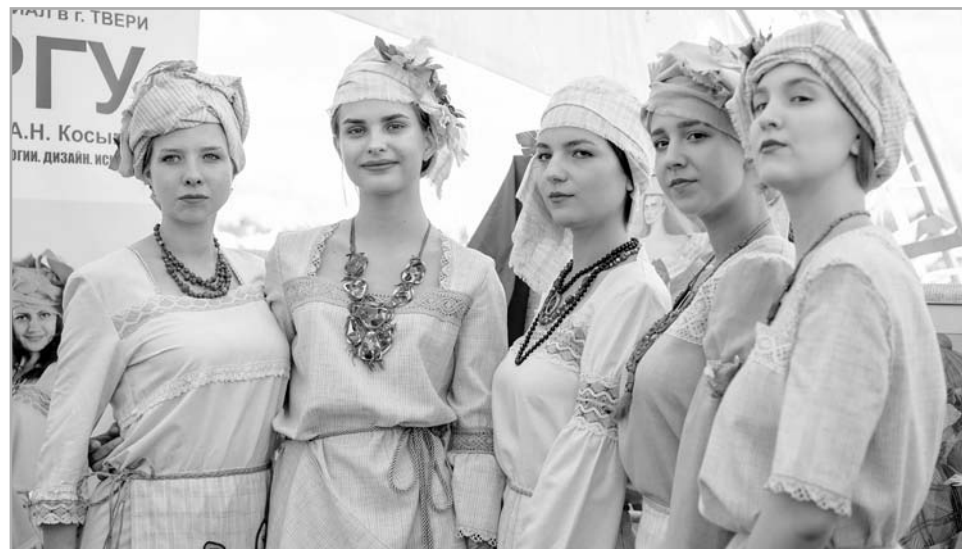
На выставке были представлены коллекции одежды из льняной ткани

Благодаря региональной поддержке, посевные